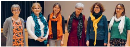
Kreative Frauen aus Degersheim und Wolfertswil organisierten den Weltgebetstag.

KIRCHE Der Weltgebetstag ist die grösste und älteste ökumenische Basisbewegung von Frauen und wird in über 120 Ländern in ökumenischen Gottesdiensten begangen. Jedes Jahr schreiben Frauen aus einem anderen Land der Welt die Liturgie zu diesem weltumspannenden Anlass. Es ist wichtig, daran teilzunehmen, da es immer um Gerechtigkeit, Frieden und die Rechte von Frauen und Mädchen geht. Auch die Evangelisch-reformierte Kirchgemeinde Degersheim hat sich wieder daran beteiligt. Dem Aufruf zu diesem Treffen in einer Gemeinschaft von Beten und Handeln folgten rund 30 Personen. Dies wie stets am ersten Freitag im Monat März im evangelischen Kirchgemeindehaus. Diesmal brachten Frauen aus Zimbabwe im gemeinsamen Gebet ihre Sorgen, Wünsche und Hoffnungen vor Gott. Das Thema war «Steh auf, nimm Deine Matte und geh Deinen Weg». Die Kollekte belief sich auf erfreuliche 638.40 Franken. Der Anlass wurde durch kreative Frauen aus Degersheim und Wolfertswil organisiert. Nächstes Jahr findet die Feier am Freitag, 5. März 2021, statt. Frauen aus Vanuatu werden dann die Liturgie schreiben, und zwar zum Thema «Build on a strong Foundation».