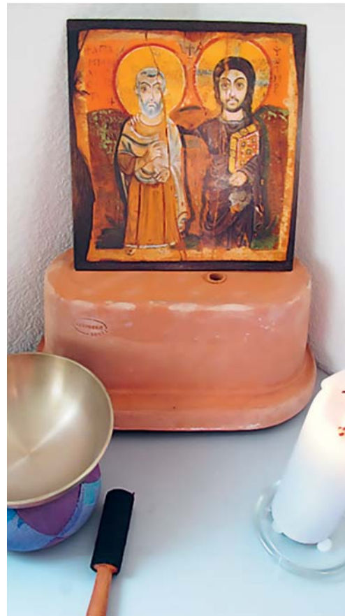
Mit Exerzitien stille Zeiten im Alltag einbauen.