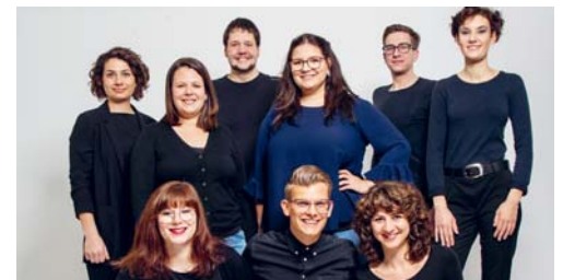
Der Verein Musicalfieber Flawil hat sich vergrössert.