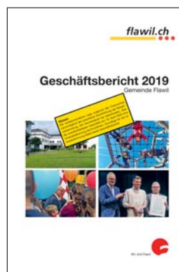
Die Frontseite des Geschäftsberichts 2019 der Gemeinde Flawil.

Der Geschäftsbericht 2019 ist auf www.flawil.ch unter der Rubrik «Aktuelles → Dokumentationen» aufgeschaltet. Die Detailrechnungen sowie eine Aktivitätenliste, viele Statistiken und eine Übersicht über die Personalmutationen sind gleichenorts zu finden.