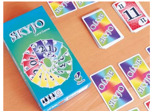
Skyjo: Kartenspiel für Krisenzeiten.

Ein Spieltipp des Teams der Bibliothek Ludothek Degersheim kann helfen, die Corona-Krise besser zu überstehen. Skyjo ist ein Kartenspiel für 2 bis 8 Spieler ab 8 Jahren. Es dauert rund 30 Minuten. Das Spiel enthält 150 Karten mit Zahlenwerten von -2 bis +12. Es läuft über mehrere Runden und endet, sobald ein Spieler 100 Punkte erreicht hat. Wer am Ende die wenigsten Punkte gesammelt hat, gewinnt.