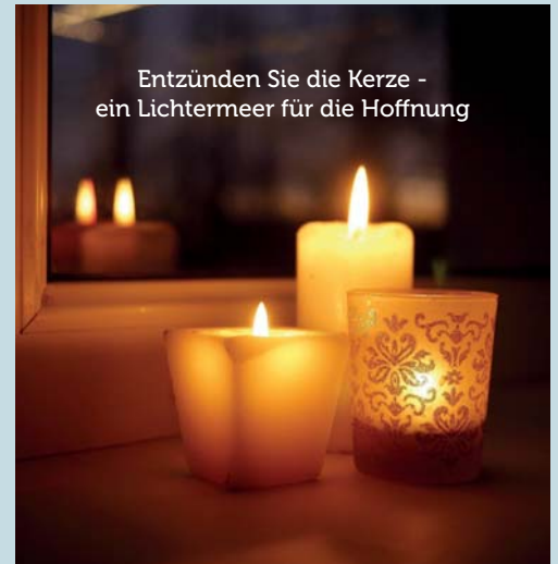
Wachen und beten. Zum Beispiel mit der Aktion der Evangelischen Kirchen Schweiz.