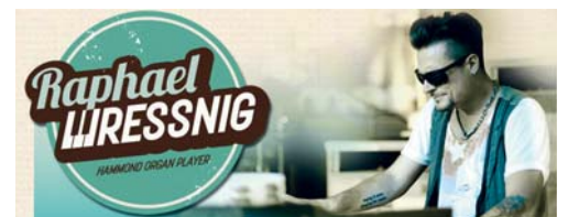
Das Raphael-Wressnig-Trio tritt im Pfarreizentrum Flawil auf.

WUSSTEN SIE, DASS ES IN FLAWIL EINEN BUUREWEG GIBT?