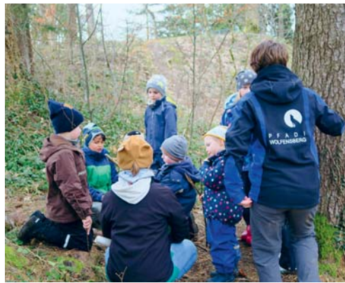
Kinder können Pfadiluft schnuppern.