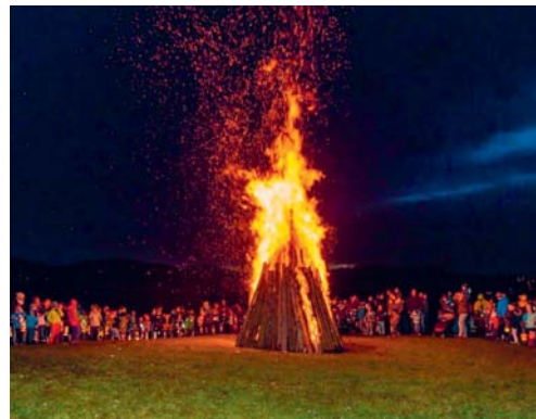
Der Bögg trotzte den Flammen nicht lange.

satoren des Verkehrsvereins Degersheim bereits auf einen rundum geglückten und schönen Anlass zurückblicken.