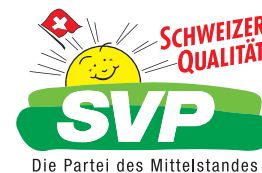
Anzeige offeriert.