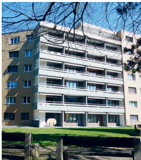
Die Seniorensiedlung Feld bezieht ihre Wärme vom Nahwärmeverbund.

Zusammen mit der Schulgemeinde Flawil und der evangelischen Kirchgemeinde ist die GSF Trägerin eines Nahwärmeverbundes. Dieser versorgt das Oberstufenzentrum, den Turnhallenkomplex, den Kindergarten, die Seniorenwohnungen, den Lindensaal, die evangelische Kirche und das alte und neue Schulhaus Feld mit Wärme. Die Heizzentrale ist inzwischen völlig veraltet und