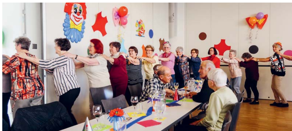
Polonaise am Musiknachmittag.