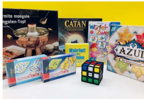
Viele neue Spiele warten auf Kinder und Erwachsene.