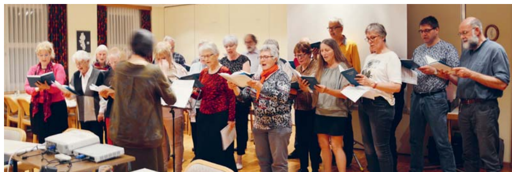
Der evangelische Kirchenchor bei einer Probe.