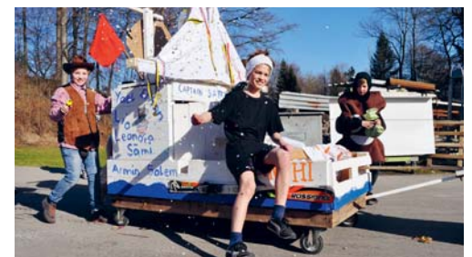
Wolfertswil in Fasnachtslaune.