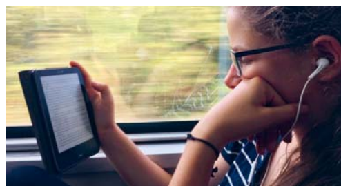
Mit einem Abonnement der Bibliothek Ludothek erhält man auch Zugang zur digitalen Bibliothek.