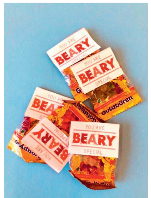
Dieses Jahr verteilte der Schülerratspräsident die Valentinstagsbotschaften zusammen mit einem Päcklein Gummibären.

die Initiative vom Schülerrat ausging. Die Arbeit des Schülerrates wird von allen sehr geschätzt. Das Gremium ist ein wichtiges Bindeglied zwischen den Schülerinnen und Schülern und ihren Lehrpersonen.