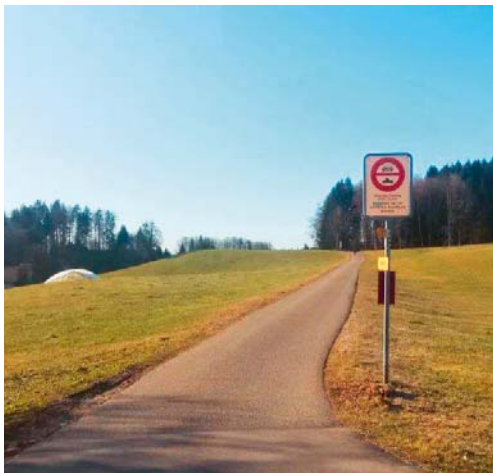
Gegen das vom Gemeinderat verfügte Fahrverbot auf der Berg-Wolfensbergstrasse wurde Rekurs erhoben.

DEGERSHEIM Der Gemeinderat Degersheim hat mit Beschluss vom 14. Januar 2020 auf der Berg-Wolfensbergstrasse die Ausdehnung des bestehenden Fahrverbotes auf alle Wochentage verfügt. Der Gemeinderat Neckertal hat für den Teil der Strasse, der auf Neckertaler Gemeindegebiet liegt, identisch entschieden. Gegen diese Verfügungen wurde beim Sicherheits- und Justizdepartement des Kantons St.Gallen ein Rekurs erhoben. Die Verfügung kann somit vorerst nicht umgesetzt werden.