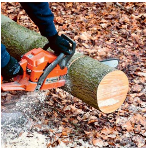
Im Bereich Magdenau werden Holzschlagarbeiten ausgeführt.

DEGERSHEIM Aufgrund von Holzschlagarbeiten im Bereich Magdenau wird die Eichstrasse in Richtung Nassen bis hin zur Einmündung Dotenwilerstrasse vom 3. bis 5. März 2020 für jeglichen Verkehr gesperrt. Eine Umleitung wird nicht signalisiert.