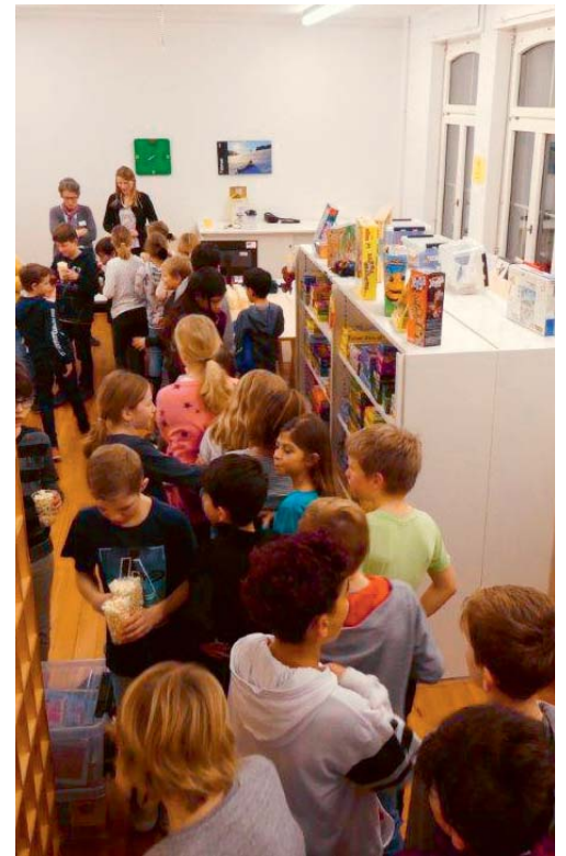
Viele Kinder nahmen an der Kinonacht in der Bibliothek Ludothek teil.

Im Vorfeld des Kinoabends fand eine Abstimmung statt, welcher Film gezeigt werden sollte. Der Animationsfilm «Everest – Ein Yeti will hoch hinaus» ging als Sieger hervor. Über 40 Kinder besuchten die Vorführung des Filmes über einen Yeti, der nach Hause zum Himalaya möchte. Das Mädchen Yi und ihre Freunde, die zusammen mit dem Yeti «Everest» durch halb China reisen und dabei einige Abenteuer zu bestehen haben, sorgten dafür, dass alle Augen gebannt auf die Leinwand gerichtet waren. Bedauerlicherweise schaffte es der Yeti trotz seinen Zauberkraften nicht, dass es in Degersheim in diesen zwei Stunden tiefer Winter wurde. Schneeweiss war dafür das Popcorn, das zu einem Kinobesuch gehört und in der Pause becherweise geknabbert wurde. Diejenigen, die den tollen Kinoabend verpasst haben, können den Film auf DVD in der Bibliothek Ludothek ausleihen – zusammen mit vielen anderen Filmneuheiten, die zu interessanten, lustigen oder spannenden Kinoabenden zu Hause auf dem Sofa einladen. Auch eine Popcornmaschine steht in der Ludothek zur Ausleihe bereit.