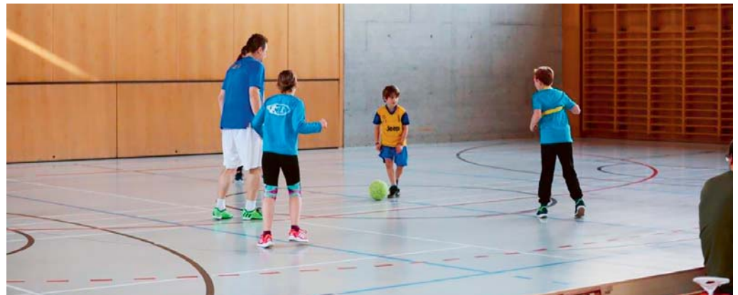
Beim ersten Kita-Fussball-Cup zeigten alle Teilnehmenden grossen Einsatz.

Teilnehmenden alles abverlangte. Um den roten Köpfen etwas entgegenzuwirken, wurde die Spielzeit daraufhin auf acht Minuten reduziert. Für die nötige Erholung und Stärkung nach den ersten Spielrunden sorgte eine Znünpause. Anschliessend wurde bis zum Mittag die Vorrunde zu Ende gespielt. Bei Gemüsedips, Hot Dogs und gemütlichen Plaudereien holten sich die Sportler die nötige Kraft, um auch in den Platzierungsspielen noch einmal alles aus sich herauszuholen zu können. An der Rangverkündigung wurde allen Kindern ein Preis und eine Medaille zum Andenken überreicht. Der erste Kita-Cup sorgte für grosse Begeisterung, verlief unfallfrei und bleibt bei allen in bester Erinnerung.