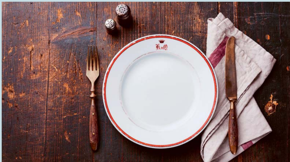
Die Fastenzeit ist immer eine grosse Chance.

Die Fastenzeit ist eine grosse Chance innezuhalten, eine bewusste Standortbestimmung zu machen und dankbar wahrzunehmen, wo wir Beschenkte sind und wo wir selber anderen Menschen Gutes tun, aber auch, wo wir gegenüber anderen und uns selbst gleichgültig sind oder wo unser Denken, Tun und Handeln andern und uns selber sogar schadet.