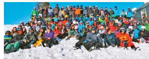
Auf dem Bild vereint: die erste Oberstufe von Flawil im Wintersportlager in Wildhaus.

sich. So hatte es nun endlich genügend Schnee, die Pisten waren weiss und konnten präpariert werden. Die Jugendlichen konnten das Skifahren und das Snowboarden während der restlichen Tage bei angenehmen Temperaturen, viel Sonnenschein und Schnee geniessen. Als Ende Woche die Heimreise angetreten wurde, durften alle Beteiligten auf ein gelungenes und unfallfreies Lager zurückblicken.