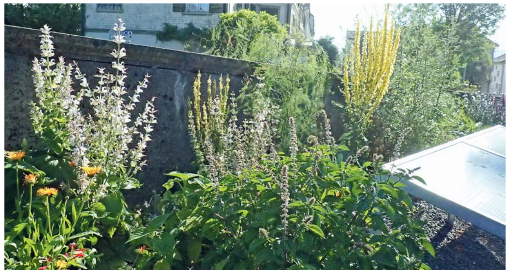
Die HV des Verkehrsvereins Degersheim findet am 2. Mai 2020 statt. Anschliessend wird das Label «Grünstadt Schweiz» gefeiert.

im Anschluss an die Hauptversammlung des Verkehrsvereins auf dem Wolfensberg statt. Aus diesem Grund wurde der Termin für die Hauptversammlung des Verkehrsvereins vom Samstag, 25. April 2020, auf den Samstag, 2. Mai 2020, verschoben. Die Hauptversammlung beginnt um 10.00 Uhr. Anschliessend, ab 11.00 Uhr, ist die ganze Bevölkerung zum Festakt eingeladen.