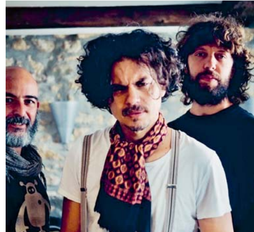
Aureliano und Baro Drom Orkestar sind am kommenden Samstag im Kulturpunkt zu sehen.