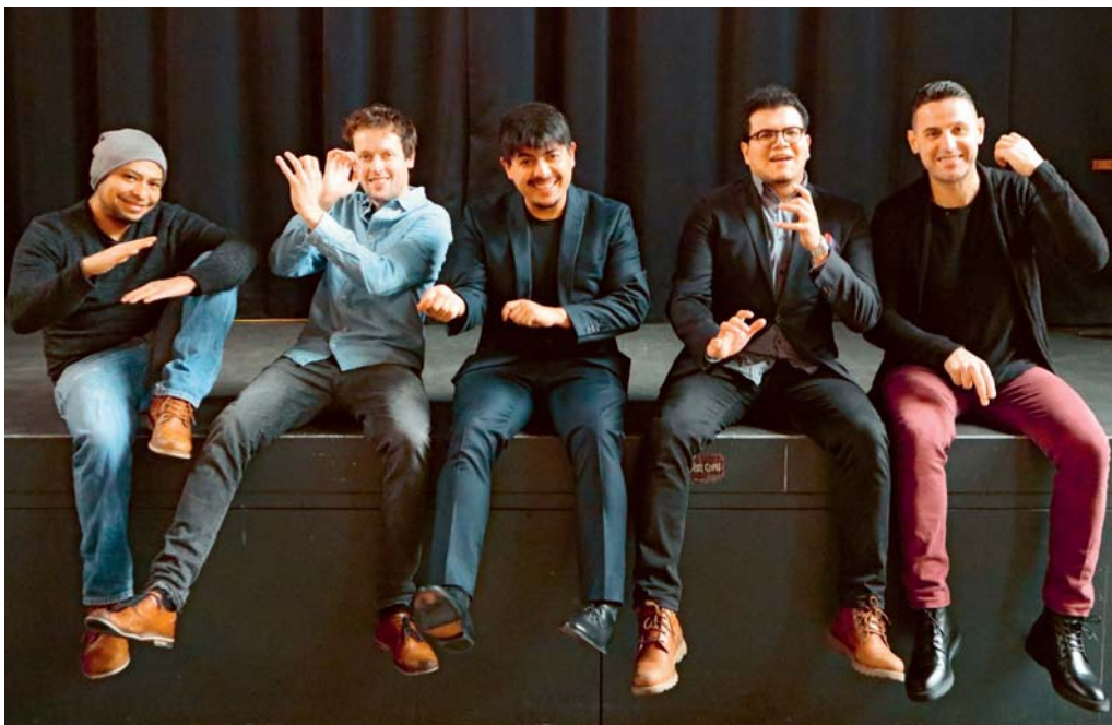
Chevere Latin Jazz Collective: kulturelle Einflüsse aus fünf Heimatländern

KULTUR So vielfältig wie die Herkunft der Musiker aus verschiedenen Ländern, so farbig-fröhlich ist auch die Musik des Chevere Latin Jazz Collective, das am morgen Samstag, 15. Februar 2020, im Kulturpunkt zur Fiesta lädt. Sie lieben die Unterschiede und tauschen sich aus – ganz besonders musikalisch. Denn das fünfköpfige Kollektiv vereint Musiker aus Mexiko, Griechenland, Ecuador, der Schweiz und Deutschland. Und natürlich die kulturellen Einflüsse ihrer je-