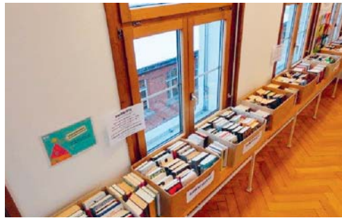
Aussortierte «Worststeller» in Flohmarktkisten

Nicht alle Bücher und Spiele werden zu «Bestsellern» und viel ausgeliehen. Die «Worstseller», aber auch alte oder kaputte Bücher und Spiele werden jedes Jahr aussortiert. Im letzten Jahr waren das total 1200 Stück. Diese Bücher und Spiele werden am Flohmarkt, der noch bis 22. Februar