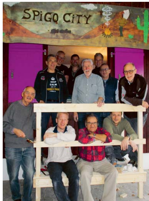
Mitglieder des Kiwanis-Clubs Gossau-Flawil vor dem neuen Podest auf dem öffentlichen Spielplatz.