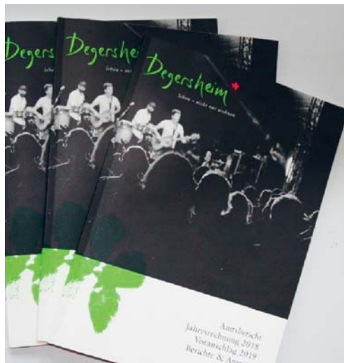
Amtsbericht der Gemeinde Degersheim

Ab Anfang März 2020 liegt der Amtsbericht auch bei der Gemeindeverwaltung auf. Es besteht dann die Möglichkeit, den vollständigen Bericht auf der Homepage der Gemeinde Degersheim, www.degersheim.ch , unter der Rubrik Politik/ Amtsbericht, aufzurufen.