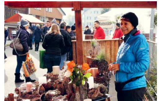
Fröhliche Stimmung am Wolfertswiler Weihnachtsmarkt.