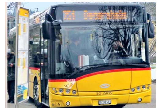
Der Regionalbus der Linie 751 fährt in Zukunft während der Hauptverkehrszeit im Halbstundentakt.

Am 15. Dezember 2019 treten mit dem Fahrplanwechsel Änderungen in Kraft. In der Region Flawil–Degersheim kommt es zum Angebotsausbau auf der Regionalbuslinie 751 zwischen Flawil und Degersheim. Seit dem Fahrplanwechsel im Dezember 2018 und der Rückkehr auf die alte Linieneinführung von Flawil via Magdenauerstrasse und Magdenau nach Degersheim und zurück wird die Regionalbuslinie deutlich mehr frequentiert. Dies hat zur Folge, dass ab 15. Dezember 2019 zu den Stosszeiten am Morgen und am Abend zusätzliche Postautos verkehren. An den Werktagen zwischen 6 Uhr und 8 Uhr sowie zwischen 16 Uhr und 18 Uhr fahren die Regionalbusse künftig im Halbstundentakt. Diese Taktverdichtung gilt auch auf dem Rundkurs vom Bahnhof Flawil zum Weiler Burgau und zurück. Eine Änderung gibt es auch auf der Regionalbuslinie 767 von und nach Lütisburg. Mit dem Fahrplanwechsel wird zwischen Flawil und Rindal die Haltestelle Buebental wieder eingeführt.