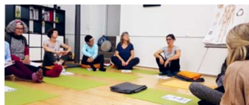
Am Anlass der Frauengemeinschaft drehte sich alles um das Thema «Wellness für Körper und Geist».

praktischen Übungen liess die Gruppe den Abend mit einer Energiesuppe und einem Chai-Tee ausklingen. Yvonne Zimmermann