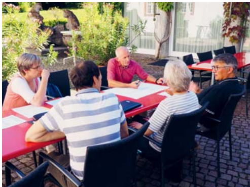
Diskussionen an der Rätetagung.

KIRCHE Wenn am Ende dieses Monats das Jahr wechselt, geht auch die vierjährige Amtsdauer der Kirchenverwaltungs- und Pfarreiräte der Seelsorgeeinheit Magdenau zu Ende. Es ist ein Übergang, der nicht nur den Wechsel von einer zur anderen Amtsdauer anzeigt, sondern auch in der Struktur der Gremien grosse Veränderungen mit sich bringt. So haben sich die vier Kirchgemeinden zu einer einzigen Kirchgemeinde Region Flawil-Degersheim zusammengeschlossen und gehen ab dem 1. Januar 2020 gemeinsam auf den Weg. Die Pfarreiräte werden je Pfarrei durch ein sogenanntes Pfarreigremium ersetzt, das sich mit den pastoralen Gegebenheiten vertraut macht, Pfarreiangehörige verbindet und dafür sorgt, dass ein Pfarreileben vor Ort weiterhin blühen darf. Dank dem vielfältigen Engagement der Pfarreimitglieder darf auch künftig jede Pfarrei ihre je eigenen Glaubenserfahrungen machen und für viele ein Stück Heimat sein. eing.