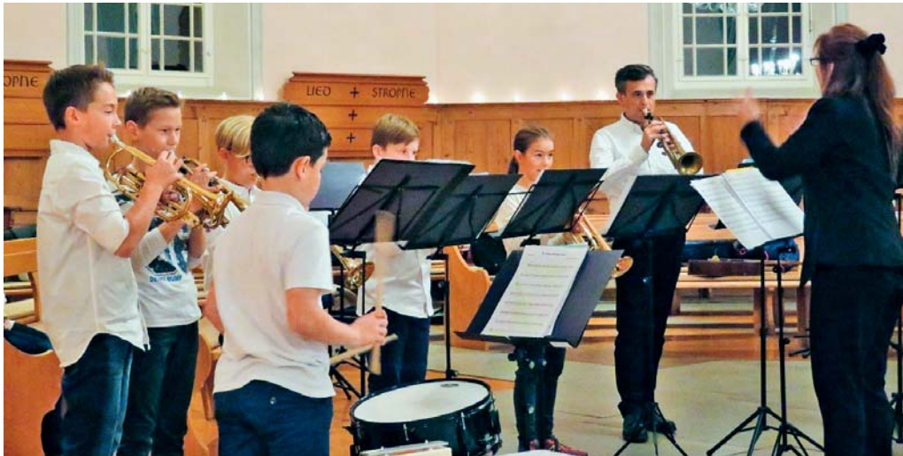
Auch das Bläserensemble tritt in der Kirche Oberglatt auf.

tentrio, das Bläserensemble und consuono, das junge Orchester Flawil-Degersheim. Auch die schöne Orgel wird gespielt von einer Klavierschülerin. Das gemeinsame Singen soll dabei nicht zu kurz kommen. Das Publikum ist eingeladen, gemeinsam mit Streichern und Bläsern in ein Weihnachtslied einzustimmen. Die Schülerinnen und Schüler sind eifrig am Üben und Vorbereiten. Sie freuen sich mit ihren Lehrpersonen auf ein stimmungsvolles Konzert und laden die Flawiler Bevölkerung herzlich ein in die schöne Kirche Oberglatt.