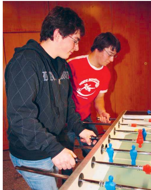
Die Jugendarbeit in Degersheim wird neu organisiert.