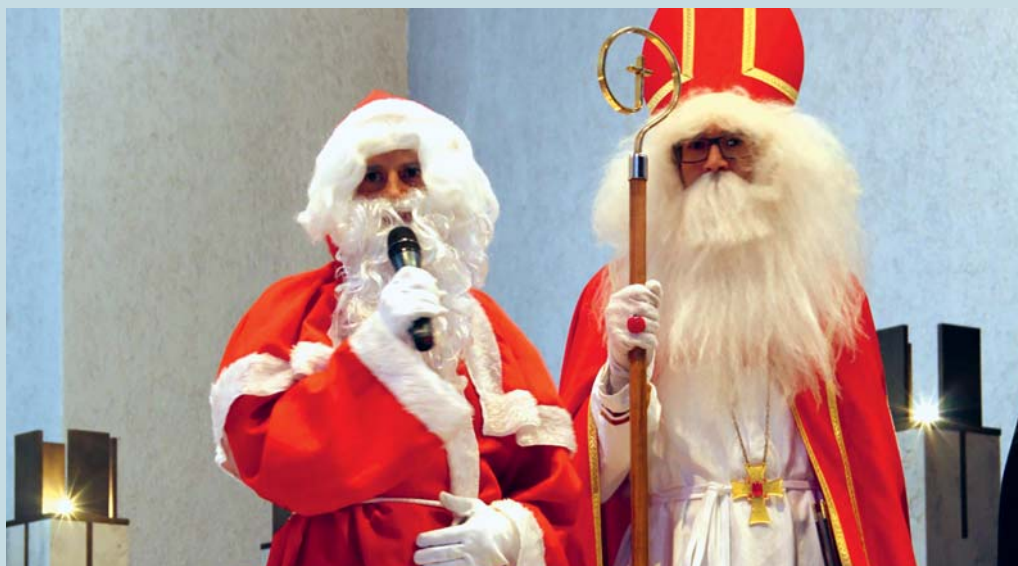
Die Gestalt des Weihnachtsmannes geht vor allem auf die europäischen Volkslegenden um den heiligen Nikolaus zurück; er ist aber keinesfalls mit diesem gleichzusetzen.

Die Gestalt des Weihnachtsmannes geht vor allem auf die europäischen Volkslegenden um den heiligen Nikolaus zurück; er ist aber keinesfalls mit diesem gleichzusetzen. Nikolaus von Myra war ein Bischof im 4. Jahrhundert, um den sich zahlreiche Legenden ranken. Seine Bekleidung besteht aus dem Bischofsornat mit Mitra, Chormantel, Kreuz und Bischofsstab. Schon im Mittelalter wurden Kinder am Gedenktag von Sankt Nikolaus am 6. Dezember beschenkt. Dieses Datum war früher auch der Bescherungstag, der erst im Laufe der Reformation und infolge deren Ablehnung der Heiligenverehrung in vielen Ländern auf das Weihnachtsfest gelegt wurde. Übrigens findet Knecht Ruprecht seinen Ursprung in den keltischen Perchten, die den Winter austreiben sollten und als Gegenspieler des Sankt Nikolaus eigentlich am Vortag des 6. Dezembers gefeiert wurden. Mit der Zeit sind diese beiden Gedenktage «zusammengeschmolzen» und Knecht Ruprecht wurde zum Begleiter von Sankt Nikolaus. Die Gestalt des heiligen Bischofs Nikolaus wurde Mitte des 19. Jahrhunderts säkularisiert, wurde