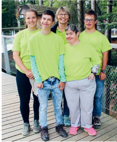
Das Personal des Baumwipfelpfades Neckertal und die beteiligten Personen der Stiftung Sántisblick können auf eine erfolgreiche Zusammenarbeit zurückblicken.