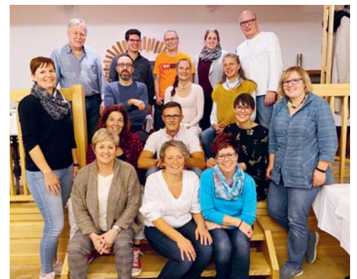
Alle Helfer und die Organisatoren des Ferienplauschs wurden zu einem feinen Nachtessen eingeladen.