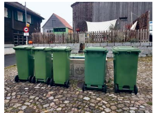
Die Bioabfuhr findet im Winter alle zwei Wochen statt.

Die Bioabfuhr stellt im Winter auf den Zwei-Wochen-Rhythmus um. Die nächste Sammeltour findet am Donnerstag, 19. Dezember 2019, statt. Im Januar 2020 werden die Touren am 2., 16. und 30. Januar durchgeführt. Alle weiteren Termine sind dem Abfallkalender zu entnehmen, welcher wie üblich der letzten FLADE-Blatt-Ausgabe 2019 (20. Dezember) beiliegen wird. In der kalten Jahreszeit sollten die Container in der Garage oder in einem nicht gefrierenden, windgeschützten Raum lagern.