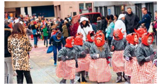
Bald ist wieder Flawiler Fasnacht.