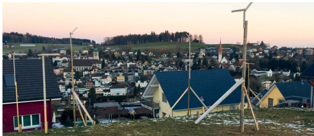
Der Zonenplan, das Baureglement und der Strassenplan liegen vom 18. November bis zum 17. Dezember 2019 öffentlich auf.

Der Zonenplan, das Baureglement und der Strassenplan liegen vom 18. November bis zum 17. Dezember 2019 im Gemeindehaus öffentlich auf. Sämtliche Unterlagen können auf der Gemeinderatskanzlei oder auf der Homepage der Gemeinde Degersheim unter www.degersheim.ch eingesehen werden. Allfällige Einsprachen haben einen Antrag und eine Begründung zu enthalten.