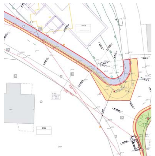
Auf der nördlichen Seite der Grubenstrasse, zwischen den Einlenkern Ruhbergstrasse und Meierseggstrasse, ist der Bau eines Trottoirs (violett eingefärbt) vorgesehen.

Der Gemeinderat hat das Strassenbauprojekt «Grubenstrasse / Neubau Trottoir», den Teilstrassenplan, den Landerwerbsplan sowie den Signalisations- und Markierungsplan genehmigt. Das Projekt liegt nun während 30 Tagen, vom 18. November 2019 bis 17. Dezember 2019, im Gemeindehaus Flawil, Bahnhofstrasse 6, im 3. Stock beim Anschlagbrett des Geschäftsfeldes Bau und Infrastruktur zur öffentlichen Einsichtnahme auf. Während der Auflagefrist kann gegen das Strassenbauprojekt beim Gemeinderat Flawil schriftlich Einsprache erhoben werden.