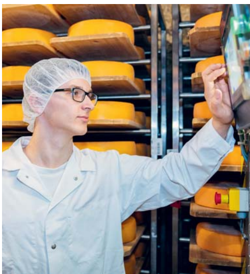
In Flawil finden die ersten Schweizermeisterschaften der Milchtechnologen statt.

Neben den Wettkampf-Disziplinen bieten die SwissSkills der Milchtechnologinnen und Milchtechnologen ein vielfältiges Rahmenprogramm. Während des ganzen Tages präsentieren Experten Entwicklungen und Foodtrends in der Milchbranche. Bei einem Käseplatten-Kreations-Wettbewerb werden die schönsten und kreativsten Käseplatten auserwählt. Im Weiteren findet ein Sinnesparcours statt, der mit Sinneserlebnissen rund um Milchprodukte beeindruckt.