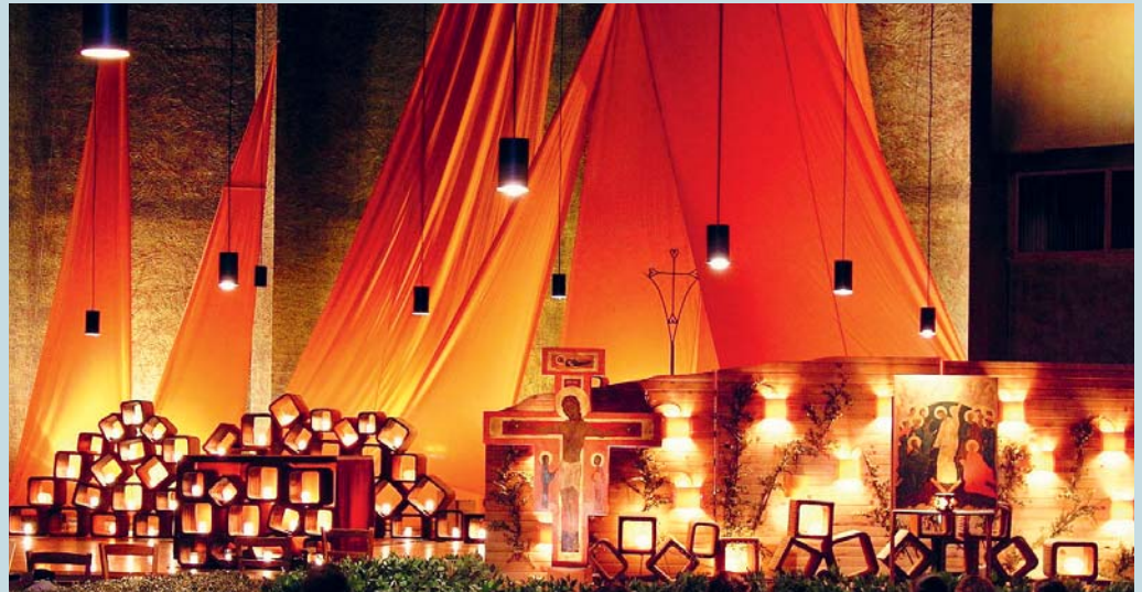
In den Taizé-Andachten und -Gottesdiensten können Sie entschleunigen, beten, singen, in die Stille gehen und Kraft schöpfen.

Jedes Jahr machen sich junge Menschen aus unseren Kirchgemeinden in das kleine Dorf Taizé im französischen Burgund auf. Taizé ist seit vielen Jahren ein Ort der Begegnung zwischen Christen und Christinnen der ganzen Welt. Der reformierte Schweizer Roger Schutz (Frère Roger) gewährte hier während des Zweiten Weltkriegs jüdischen Flüchtlingen Schutz vor der Gestapo. Im Herbst 1944 gründete er den weltweit ersten ökumenischen Männerorden. Die Brüder von Taizé sind evangelisch, katholisch, orthodox und anglikanisch und stammen aus den unterschiedlichsten Teilen der Welt. Mittelpunkt des Campus von Taizé ist die Versöhnungskirche, in der die Brüder täglich dreimal Gottesdienste mit den anwesenden Gästen feiern. Zigtausende Menschen aus allen Kontinenten finden jährlich den Weg hierher, um eine oder zwei Wochen zur Ruhe zu kommen, zu beten, zu singen und mit anderen Christinnen und Christen die Bibel zu lesen. Die Liturgie der Gottesdienste ist einfach und die Taizé-Gesänge sind weltberühmt. Einige von ihnen haben Eingang in unser Gesangbuch gefunden. Nun haben nicht alle von uns Zeit, sich nach Taizé aufzumachen – und es wäre ja auch schön, den Geist von Taizé in unseren Alltag