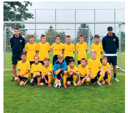
Die erfolgreichen D-Junioren des FC Neckertal-Degersheim.