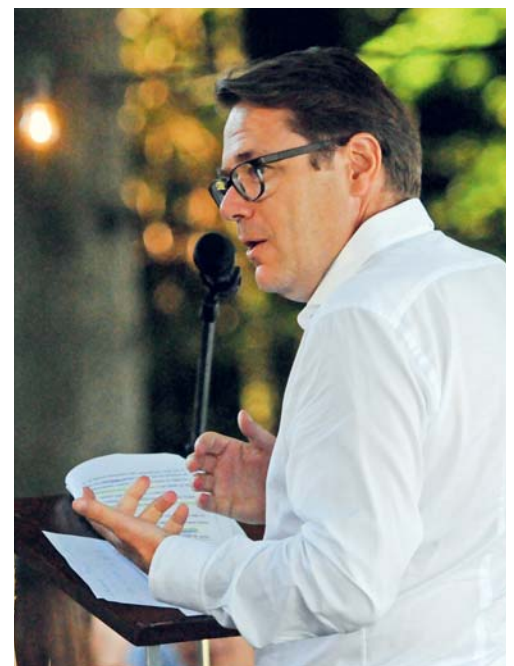
Bei der Degersheimer Bundesfeier im Föhrenwäldli.