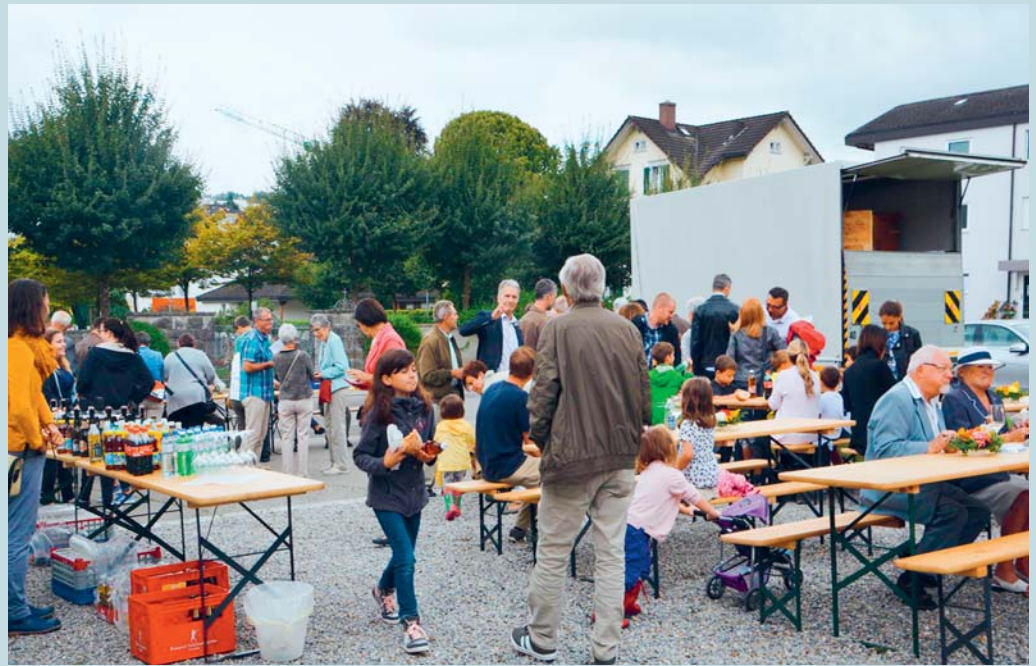
Das Laurentiusfest wird zusammen mit Gästen aus der Partnerpfarrei Kangemi in Kenia gefeiert.

Anschliessend sind alle ganz herzlich zum Apéro eingeladen. Dann wird ein gemütlicher Zmittag bei Wurst und Brot auf dem Kirchenplatz angeboten. Dazu wird ein abwechslungsreiches Unterhaltungsprogramm für Jung und Alt organisiert. Herzliche Einladung an alle! Hans Brändle