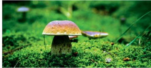
Demnächst beginnt für die Pilzsammler die Hauptsaison.

Während der Hauptsaison vom 18. August bis 27. Oktober 2019 werden die gesammelten Pilze jeweils am Dienstag und Sonntag von 18.30 bis 19 Uhr im Pilzlokal, Werkhof, Fabrikstrasse 28, Bischofszell durch die Pilzkontrollleurin begutachtet. Ausserhalb der Hauptsaison finden die Kontrollen auf telefonische Voranmeldung statt. Weitere Informationen sind auf www.flawil.ch unter der Rubrik «Gemeindehaus → Externe Dienststellen → Pilzkontrolle» zu finden.