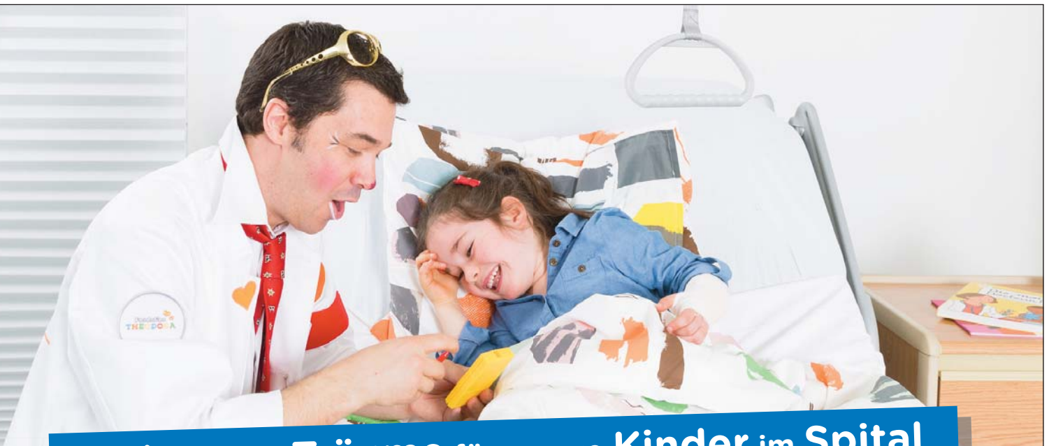
Anzeige offeriert.