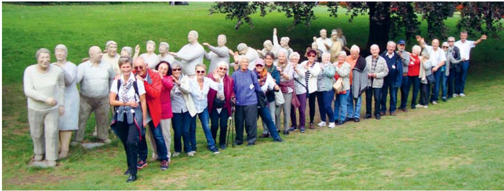
Die ökumenischen Seniorenferien finden dieses Jahr in Davos statt.