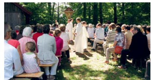
Die kleine Waldoase im Böhlwäldli