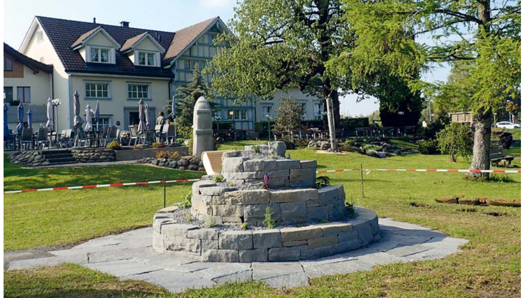
Der geplante Heilkräuterpfad führt von der Drogerie zum Föhrenwäldli, dann zum Wolfensberg und über die katholische Kirche zum Ausgangspunkt zurück.

Die Heilkräuterspirale beim Hotel Wolfensberg wurde auf dem Gelände des Hotels angelegt. Er ist barrierefrei von der Strasse her zugänglich,