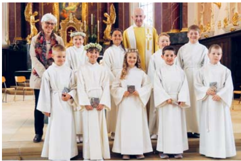
Erstkommunionkinder aus Degersheim ...