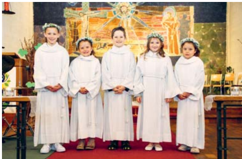
... und aus Wolfertswil