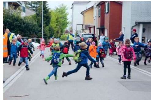
Eifrig suchen die Kinder nach Lucky Lukes Pferd.

VEREIN Am Mittwoch, 8. Mai 2019, veranstalteten Jungwacht und Blauring Degersheim einen Schnupperritt, an dem zahlreiche interessierten Schülerinnen und Schüler teilnahmen. Eine Woche zuvor wurden die Kinder dazu aufgerufen, das gestohlene Pferd von Lucky Luke zu finden. Mithilfe von drei Kartenstücken und dem Lösen von lustigen Aufgaben entdeckten sie einen auf der Karte markierten Ort, an dem sich das Pferd befinden sollte. Als die Kinder im Herrenluftbad einen Zvieri genossen, kamen plötzlich drei Mädchen mit einem Pferd vorbei. Sie hatten das Tier unterwegs gefunden und wollten es zum nächsten Bauernhof bringen. Als Lucky Luke, der die Kinder den gesamten Nachmittag begleitete, das Pferd sah, war er erleichtert: Es war sein gesuchtes Pferd. Überglücklich machte sich Lucky Luke mit ihm auf den Heimweg und die Kinder bekamen ein kleines Dankeschön für ihre tatkräftige Unterstützung. Fiona Federer