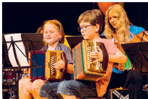
Die Tarife der Musikschule Degersheim werden teilweise leicht erhöht.

Der 30-minütige Einzelunterricht für Erwachsene wird um Fr. 80.00 erhöht. Neu kostet das Angebot Fr. 980.00 pro Semester. Ebenfalls wurde der bisherige Tarif von Fr. 80.00 für das Chorangebot für Schülerinnen und Schüler ohne Fachbelegung angepasst. Ab dem neuen Schuljahr werden pro Semester Fr. 100.00 in Rechnung gestellt. Die restlichen Tarife bleiben unverändert.