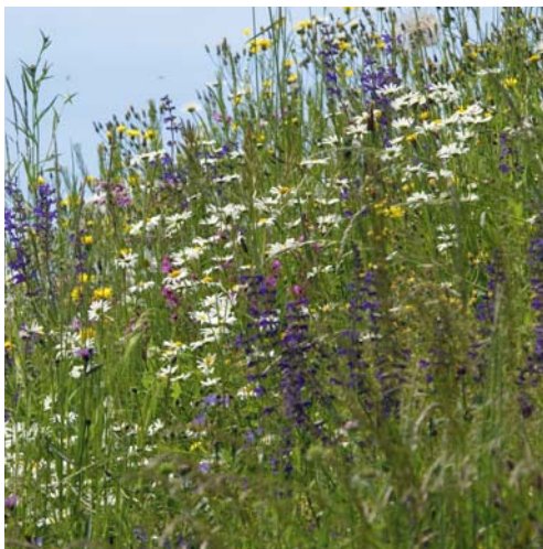
Auf einer Wanderung werden wildwachsende Kräuter rund um Flawil erkundet.