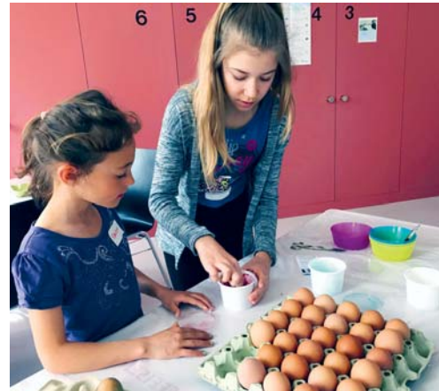
Am «Osterhasen-Nachmittag» wurden auch Eier gefärbt und verziert.

KIRCHE Kürzlich folgten 32 Kinder der Einladung der Reformierten Kirchgemeinde Flawil zum «Osterhasen-Nachmittag». Beim Basteln entstanden viele farbenfrohe Osterhasen, welche anschliessend mit einem Osternestli gefüllt wurden. Als weitere Vorfreude auf die bevorstehende Osterzeit wurden Eier gefärbt und mit viel Kreativität verziert. Mit einem feinen, selbstgebackenen Zopfchäsli durften sich die Kinder zum Zvieri stärken und sich beim Spielen im Kirchenpark vergnügen.