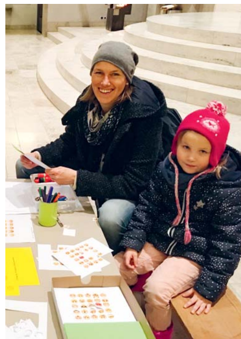
An einem der vielen Posten: ein Gebet mit Emojis – geht das?