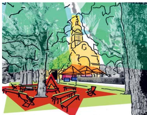
Der Park rund um die reformierte Kirche Feld wird im Sommer zum Lebens- und Begegnungsort.