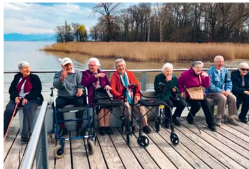
Die Gäste des Tertianums Steinegg und Degersheim genossen die «Blueschtfahrt» sichtlich.