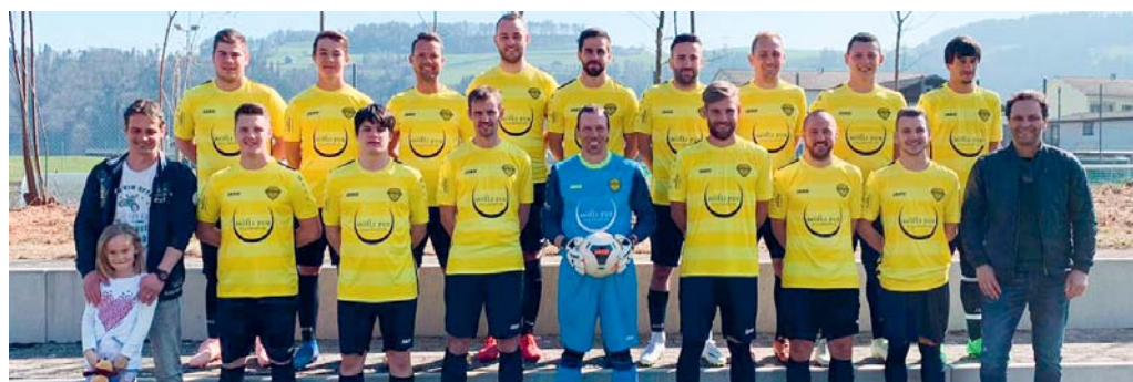
Stolz präsentiert die 2. Mannschaft des FC Neckertal-Degersheim ihre neuen Tenues.

Montag, 29. April 2019 20.00 Uhr: B-Junioren FC Neckertal-Degersheim – FC Eschlikon