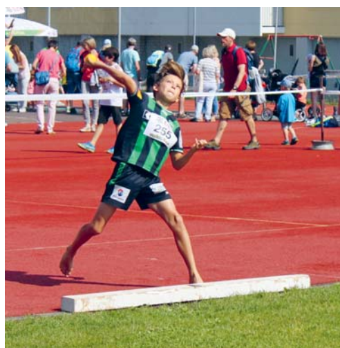
Auch dieses Jahr finden wieder die beiden beliebten Wettkämpfe «UBS Kids Cup» und «De schnellscht Flowiler» statt.