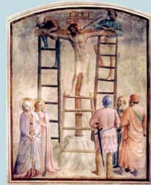
Nailing to the Cross (1450), Francesco Angelico (1400–1455, Florence, Italien).