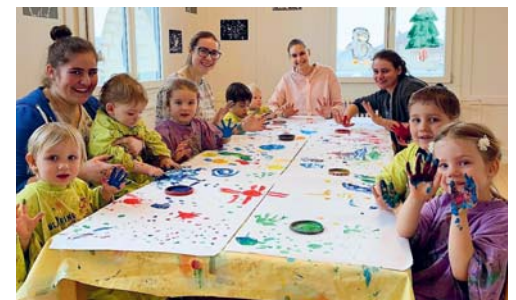
Fröhlichkeit und Kreativität werden auf der Gruppe gepflegt.

VEREIN An der Jubiläumsversammlung präsentierte das Betreuungsteam Impressionen aus dem Krippenalltag. Schwerpunkte sind im «Karussell – Haus für Kinder» die gesunde Ernährung und viel Bewegung an der frischen Luft. Ausflüge und Wanderungen gehören ebenso zum Programm wie die Gestaltung der Jahreszeiten. Ein neueres Projekt sind generationenverbindende Besuche im Wohn- und Pflegeheim. Im geschäftlichen Teil wurde die Rechnung 2018 mit einem Aufwand von rund 882'000 Franken und einem Gewinn von 500 Franken genehmigt. Seit August kann das Karussell zwölf zusätzliche Betreuungsplätze anbieten, weshalb der Aufwand beim Budget 2019 auf 890'000 Franken steigt. Die Arbeit des Vorstands wurde mit Applaus verdankt. Die Vorstandsmitglieder Daniela Mainberger, Guido Steiner und Barbara Brunner wurden einstimmig in ihren Ämtern bestätigt. Neu gewählt wurde Nirti Hofer, die das Ressort Betreuung übernimmt. Gemeinderätin Erika Schildknecht komplettiert den Vorstand. Auch die Revisorinnen, Helena Hollenstein und Mirjam Untersee, stellen sich weiterhin zur Verfügung. Mit einem grossen Dank an die Leiterin, Maya Niedermann-Bachmann, konnte die Präsidentin die Hauptversammlung schliessen.