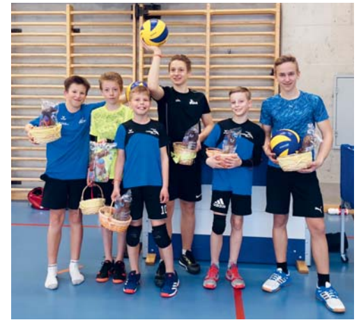
Die glücklichen Gewinner des Turniers durften ein Osternest als Preis entgegennehmen.