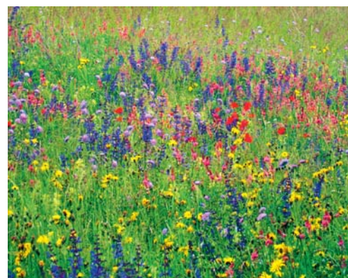
Blumenwiese statt Rasen: So wird die Biodiversität gefördert.

Mehr Informationen zur «Mission B» sind unter www.srf.ch/sendungen/treffpunkt/die-mission-b-ein-projekt-fuer-mehr-biodiversitaet zu finden.