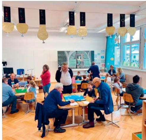
Bei einem Jassturnier konnten die 1.-Klässler ihre neu erworbenen Jassfähigkeiten zeigen.

Den Kindern und der Lehrerin wurden an drei Nachmittagen von erfahrenen Jasserinnen und Jassern des Generationen-Jassprojektes der Migros die Jass- und die Turnierregeln vermittelt. Am letzten Freitagnachmittag vor den Frühlingsferien trafen schliesslich Eltern, Grosseletern, Göttis und Gottis im Schulhaus ein, um sich mit den Schülerinnen und Schülern beim Jassen zu messen. So wurde das Klassenzimmer für einmal ein Begegnungsort verschiedener Generationen begeisterter Jasserinnen und Jasser.