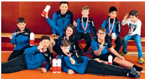
Das U13-Team (Bild) wie auch das U11-Team zeigten am regionalen Finalturnier im Volleyball in St.Gallen eine starke Leistung.