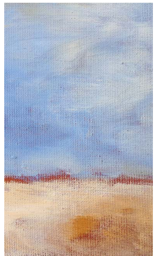
Die Kursteilnehmenden malen mit selbst angeriebener Farbe ein kleines Ölbild auf Leinwand.