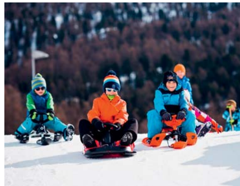
Auch beim Schlitteln sind die Sicherheitsvorschriften zu beachten.

Vielfach kennen die Schlittenfahrer und Schlittenfahrerinnen das richtige Verhalten nicht. Die Geschwindigkeit wird unter- und das Fahrkönnen überschätzt. Insbesondere Kinder bis etwa acht Jahre erkennen Gefahren erst, wenn es für eine Reaktion bereits zu spät ist. Schädel und Hirnverletzungen, Knochenbrüche oder sonstige Verletzungen an Beinen, Füssen und Rumpf sind die Folge. Die Beratungsstelle für Unfallverhütung (bfu) gibt Tipps zur optimalen Ausrüstung, zu sicherem Verhalten und zur richtigen Streckenwahl. Damit man sich aufs Schlitteln