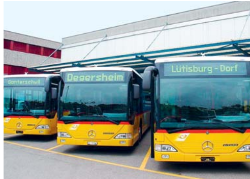
Die Postauto AG zahlt der Gemeinde Degersheim 14944.85 Franken zurück.

DEGERSHEIM Das Bundesamt für Verkehr hat im Februar 2018 im Rahmen einer Revision festgestellt, dass die Postauto Schweiz AG seit 2007 Gewinne mit unrechtmässigen Umbuchungen verschleierte. In der Folge haben das Bundesamt für Verkehr, die Kantone und die Gemeinden zu hohe Abgeltungen an die Postauto Schweiz AG bezahlt. Diese bezahlt nun insgesamt 188,1 Millionen Franken an den Bund, die Kantone und die Gemeinden zurück. Die Gemeinde Degersheim hat insgesamt 14944.85 Franken zurückerhalten. Die Rückerstattung der zu viel geleisteten Beträge wurde der Gemeinde Degersheim mit den Beiträgen für den öffentlichen Verkehr für das Jahr 2018 verrechnet.