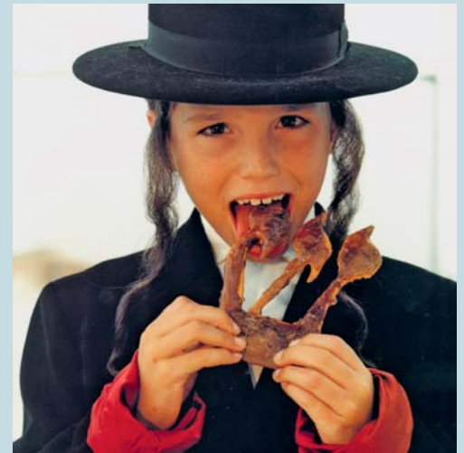
Titel des Fotos von Bettina Rheims: «Jesus labt sich an der Schrift».