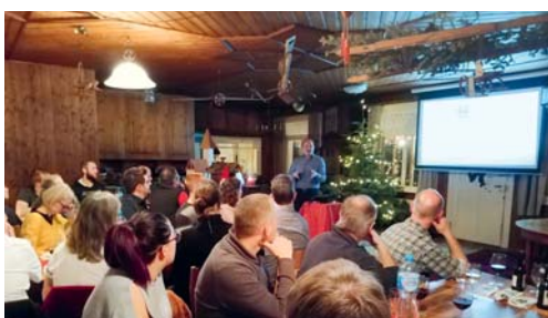
Gespannt lauschten die Anwesenden des GVD den interessanten Referaten.