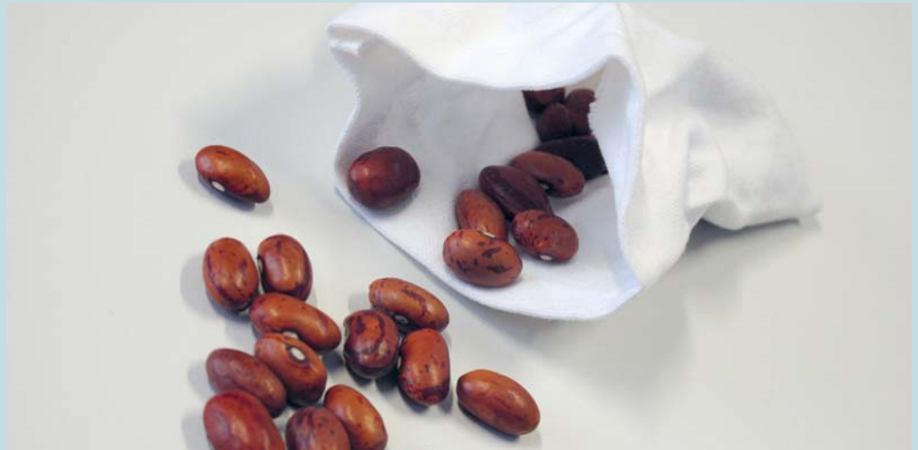
Jede Bohne steht in der Geschichte für einen schönen Moment.

Vor geraumer Zeit lebte einmal ein alter Graf. Er war ein Lebensgeniesser par excellence. Niemals verliess er das Haus, ohne sich zuvor eine Hand voll Bohnen einzustecken. Er tat dies nicht etwa, um die Bohnen zu kauen. Nein, er nahm sie mit, um die schönen Momente des Tages bewusster wahrzunehmen und sie besser zählen zu können. Denn bei jeder positiven Kleinigkeit, die er tagsüber erlebte, beispielsweise wenn ihn jemand auf der Strasse freundlich grüsste, wenn seine Frau herzlich lachte, wenn er einen schattigen Platz in der Mittagshitze fand oder wenn eine Rose am Wegrand wundervoll duftete, liess er eine Bohne von der rechten in die linke Jackentasche wandern. Manchmal waren es gleich zwei oder drei. Abends dann sass er zu Hause und zählte die Bohnen aus der linken Tasche. Er zelebrierte das Zählen förmlich und freute sich nochmals bei jeder Bohne. So führte er sich vor Augen, wie viel Schönes ihm an diesem Tag widerfahren war. Und sogar an einem Abend, an dem er bloss eine Bohne zählte, war der Tag gelungen und es hatte sich zu leben gelohnt.