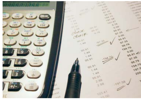
Die Steuerabrechnung ist durchwegs positiv und deutlich über dem Budget.

Bei den Gewinn- und Kapitalsteuern (juristische Personen) kann ein Ergebnis von 1,3 Millionen Franken verbucht werden. Dieses Ergebnis liegt rund 100 000 Franken über demjenigen des Vorjahres.