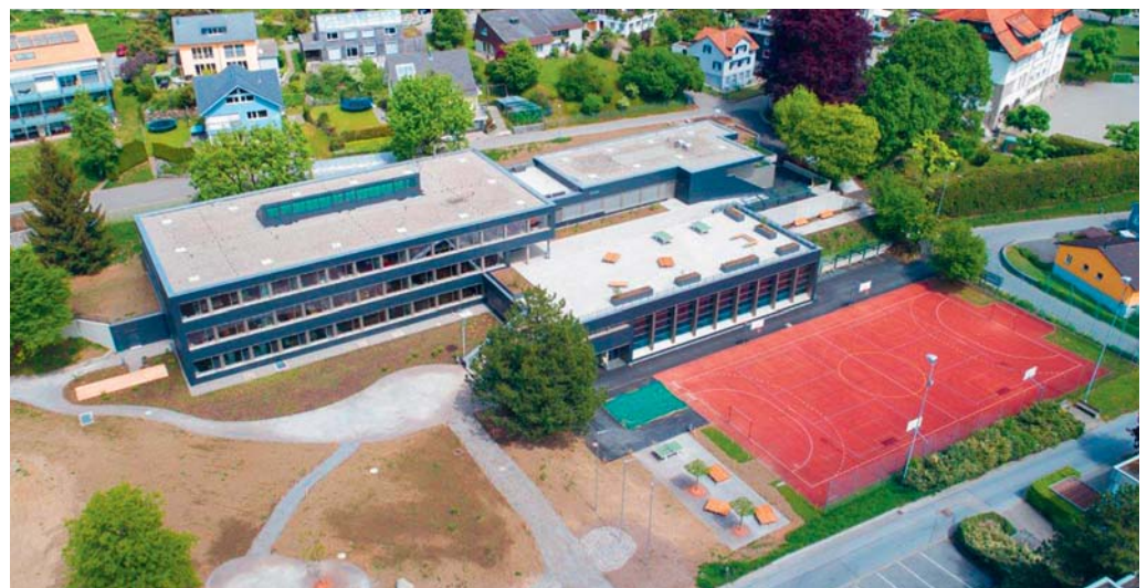
Die Kosten für die Totalsanierung des Oberstufenschulhauses liegen deutlich unter dem Budget.

Für die Sanierung des Oberstufenschulhauses wurde an der ausserordentlichen Bürgerversammlung vom November 2015 einem Kredit von 9,27 Millionen Franken zugestimmt. Zweieinhalb Jahre später waren die Bauarbeiten so weit abgeschlossen, dass das Oberstufenschulhaus im Mai 2018 wieder offiziell dem Schulbetrieb übergeben werden konnte. Nachdem die letzten Detailarbeiten erledigt und alle Aufwände verrechnet worden sind, liegt nun die Schlussabrechnung vor. Der Gemeinderat konnte erfreut zur Kenntnis nehmen, dass der gewährte Kredit bei Weitem nicht ausgeschöpft wurde.