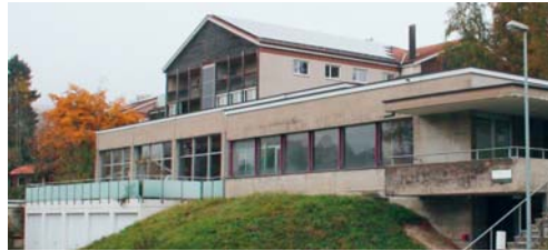
Das ehemalige Hallenbad ist mit einer Dienstbarkeit belastet.

Im Jahr 1971 verkaufte die damalige Kurhaus Sennrüti AG der Hallenbad Degersheim AG die Parzelle, auf welcher in der Folge das Hallenbad errichtet wurde. Zugunsten der Verkäuferin wurde das verkaufte Grundstück mit einer Dienstbarkeit belastet, wonach auf diesem nur der Bau und der Betrieb eines Hallenbades zulässig ist. Diese Bau- und Gewerbebeschränkung blieb bestehen, als die Gemeinde alle Aktiven und Passiven der Hallenbad Degersheim AG übernahm. Auch als die Kurhaus Sennrüti AG ihre Liegenschaft im Jahr 2009 an die Genossenschaft Ökodorf verkaufte, wurde die Dienstbarkeit nicht bereinigt. Nach der Schliessung des