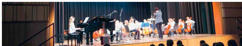
Fast 60 Kinder und Jugendliche werden in Ensembles musizieren.

in Ensembles musizieren: Bläser, Streicher, Gitarren, Akkordeons, Klavierduos und die Rockband. Mit grosser Vorfreude wird in der Musikschule geübt und geprobt. Das abwechslungsreiche Konzert wird etwa eine Stunde dauern. Die Musikschülerinnen und Musikschüler und ihre Lehrpersonen freuen sich auf eine grosse Zuhörerschaft und laden alle ganz herzlich zu diesem besonderen Konzert ein. Die Ensembles werden die Zuhörenden mit ihrer «magischen» Musik verzaubern.