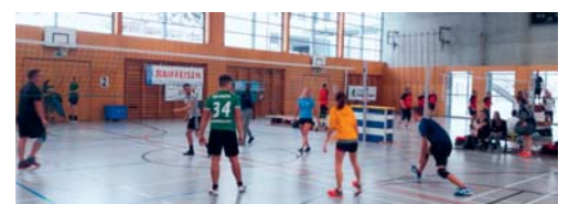
Jung und Alt spielte engagiert um die Podestplätze.