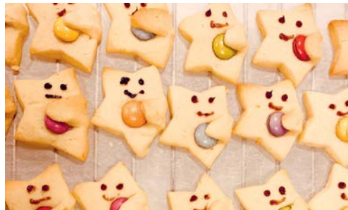
Die Frauen der Frauengemeinschaft erlebten kürzlich einen gemütlichen Abend beim Guetzlibacken.

VEREIN Auf dem Programm der Frauengemeinschaft Degersheim stand dieses Jahr auch «Die kreative Adventsbäckerei». Die Einkaufsliste für diesen tollen Abend in der Küche des Oberstufenschulhauses Degersheim war lang. Die Zutaten wurden von den 16 Frauen aus dem Dorf innert kurzer Zeit in 8 verschiedene Guetzliteige verwandelt. Dann hiess es Auswallen, Ausstechen, Backen und Verzieren. Zum Abschluss wurde das feine Gebäck dann in die Guetzlidosen verteilt. Monika Dreyer