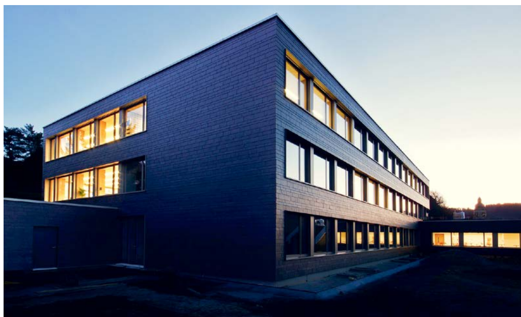
Das total sanierte Oberstufenschulhaus Degersheim konnte in Mai 2018 eingeweiht werden.

FLAWIL/DEGERSHEIM Das Jahr 2018 neigt sich dem Ende entgegen. Was hat in Flawil und in Degersheim in den zurückliegenden zwölf Monaten bewegt. Ein Blick zurück.