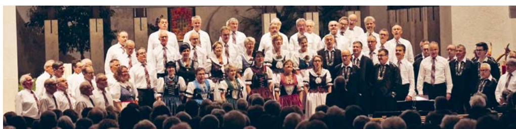
Der Männerchor Eintracht und das Freizytchörli Gossau-Flawil boten ein abwechslungsreiches Liederprogramm.