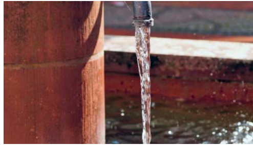
Das überarbeitete Wasserreglement der Gemeinde Degersheim tritt per 1. Januar 2019 in Kraft.

DEGERSHEIM Am 23. Oktober 2018 hat der Gemeinderat das neue Wasserreglement erlassen und dem fakultativen Referendum unterstellt. Die Referendumsfrist ist in der Zwischenzeit unbenutzt abgelaufen. Das Wasserreglement tritt per 1. Januar 2019 in Kraft. Der dazugehörige Gebührentarif tritt ebenfalls per 1. Januar 2019 in Kraft. Der Gemeinderat hat diesen an seiner Sitzung vom 18. Dezember 2018 erlassen. Die Gebühren bleiben unverändert. Geändert wurden die Verweise ins Reglement und vereinzelte Bezeichnungen.