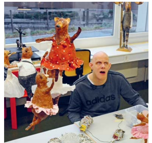
In den Werkstätten der Stiftung Sämtsblick entstehen viele tolle Produkte für den Weihnachtsbasar.