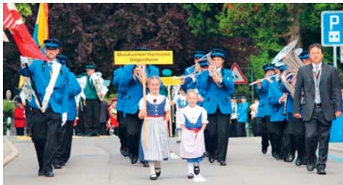
In Degersheim fanden dieses Jahr verschiedenste Kulturveranstaltungen statt.

Auch die Gemeinde freut sich sehr über die vielen kulturellen Anlässe, die in Degersheim, Wolfertswil und Magdenau stattfinden. Die vielen Möglichkeiten, sich im kulturellen Bereich zu betätigen oder einfach ein breites kulturelles Angebot geniessen zu können, machen die Gemeinde Degersheim zu einem attraktiven Wohn- und Lebensort. Allen, die sich dafür einsetzen, gebührt ein herzliches Dankeschön.