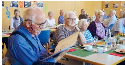
Die Gäste des Seniorennachmittags hörten viele lustige Geschichten, aber auch solche, die zum Nachdenken anregen.