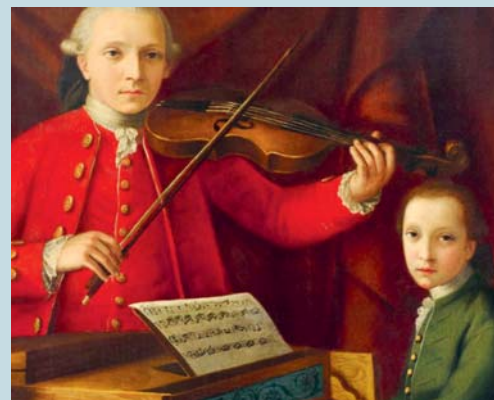
Werke von Vater Leopold und Sohn Wolfgang Amadeus Mozart bezaubern auch moderne Musikliebhaber.