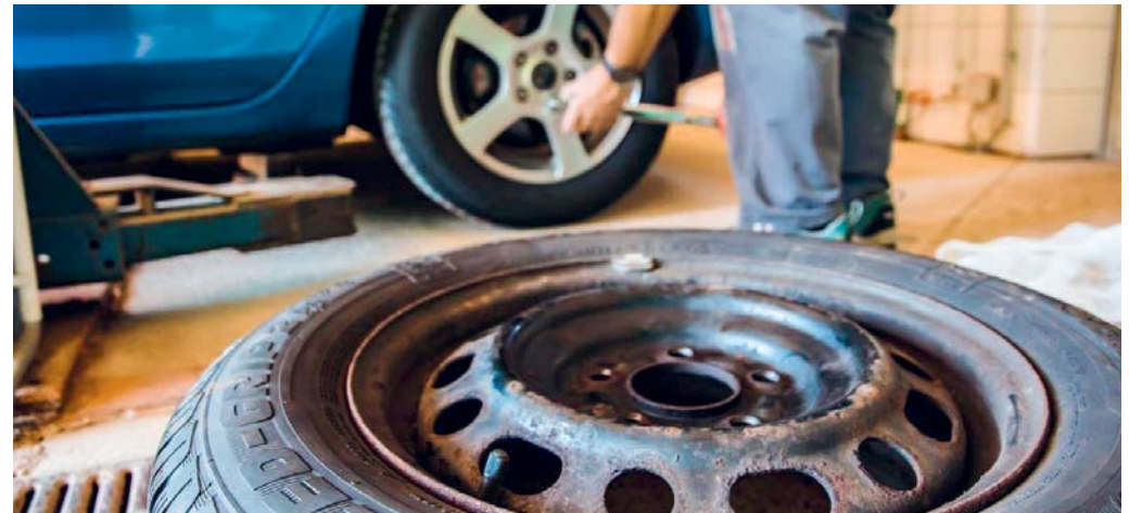
Mit Winterreifen steigt die Fahrsicherheit in der kalten Jahreszeit.

Die Beratungsstelle für Unfallverhütung (bfu) rät von Ganzjahresreifen ab. Verursacht eine Person wegen mangelhafter Ausrüstung des Fahrzeugs einen Unfall, kann die Versicherung Leistungen kürzen oder Regress nehmen. Selbst wer wegen Sommerpneus im Winter steckenbleibt und dadurch den Verkehrsfluss beeinträchtigt, kann unter Umständen wegen Verletzung der Grundverkehrsregeln zur Rechenschaft gezogen werden. Nicht nur Schnee und Eis sind eine Herausforderung für Fahrerinnen und Fahrer, auch muss die Geschwindigkeit bei nasser Fahrbahn den Verhältnissen angepasst werden.