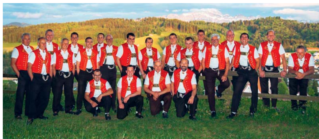
Dank grossem Einsatz von vielen Personen wird in Degersheim ein vielfältiges Kulturprogramm geboten.

DEGERSHEIM Eine Gemeinde wird erst dann lebendig, wenn sie von der Bevölkerung belebt wird. Denn ohne Musik tanzt der sprichwörtliche Bär nirgends. Für Musik und Unterhaltung sorgen in Degersheim viele Personen, die sich auf freiwilliger Basis im kulturellen Bereich engagieren. Sei es, indem sie selber kulturell tätig sind oder kulturelle Anlässe veranstalten und der Degersheimer Bevölkerung so ein buntes Unterhaltungsprogramm und Freizeitangebot anbieten.