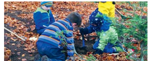
Impression aus dem Flawiler Waldkindergarten.

FLAWIL Am Freitag, 16. November 2018, stellt sich der Waldkindergarten an einem Marktstand vor dem Gemeindehaus den interessierten Personen vor. Die Kinder präsentieren Arbeiten und Fotos aus dem Kindergartenalltag im Wald und bieten Basteleien zum Verkauf an. Ausserdem gibt es Kaffee oder Tee. Die Anwesenden geben gerne Auskunft und stehen zur Beantwortung von Fragen rund um den Waldkindergarten zur Verfügung. Dabei wechseln sich Kinder, Eltern und Lehrpersonen am Stand ab. Der Stand ist von 8 Uhr bis 12 Uhr und von 14 Uhr bis 17 Uhr geöffnet.