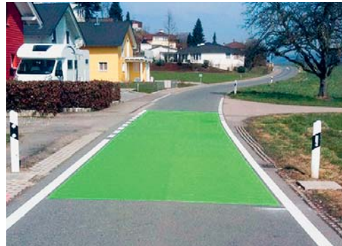
Das Beispiel einer farblichen Gestaltung von Strassenoberflächen.

cherheit der Fussgängerinnen und Fussgänger erhöhen. Da die beiden Bereiche auch wichtige Schulwege sind und auf der einen Strassenseite kein Trottoir vorhanden ist, dient die Markierung auch zur Verbesserung der Schulwegsicherheit.