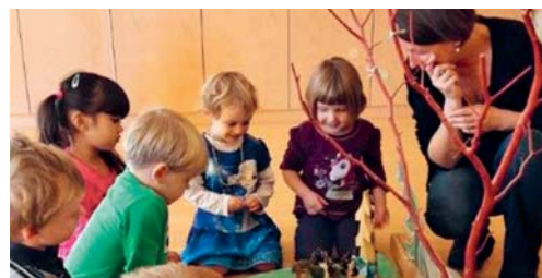
Klänge faszinieren kleine Kinder.

DEGERSHEIM Am Mittwochmorgen, 31. Oktober 2018, startet der sechsteilige Kurs Eltern-Kind-Singen im Musikschulzentrum Altbau Steinegg Degersheim. Die Ausschreibung mit Anmeldetalon kann bei der Musikschulleitung, trudi.stutz@schule-degersheim.ch, bezogen werden. Anmeldeschluss ist am 24. Oktober 2018.