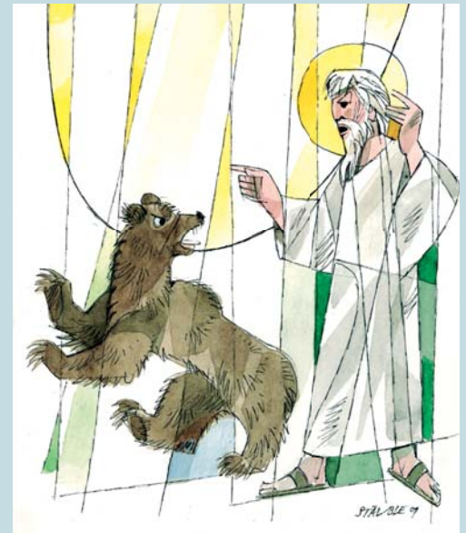
Wandermönch und Missionar Gallus wird als Heiliger verehrt.