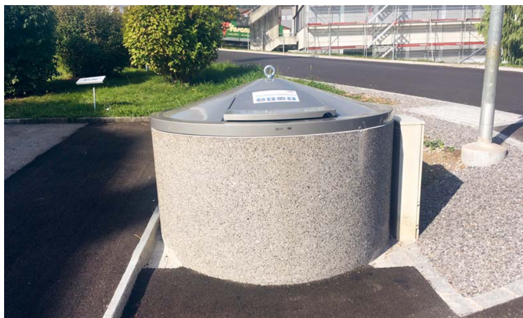
Ab Dienstag, 23. Oktober 2018, wird der Kehricht ausschliesslich in Unterflurbehältern entsorgt.