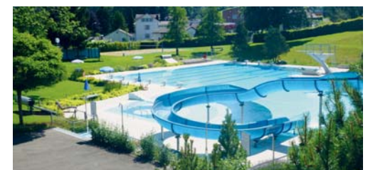
Die leere Badi Degersheim – im Winter werden zahlreiche Unterhaltsarbeiten erledigt.

Das Team der Badi Degersheim dankt allen Besucherinnen und Besuchern der Badi und freut sich auf ein Wiedersehen im nächsten Jahr.