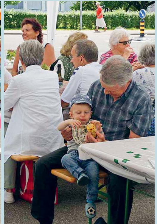
Das b'treff-Team lädt Sie herzlich zum diesjährigen Fest ein.