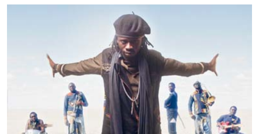
Haupttakt des Festivals sind «Sahad & the Nataal Patchwork».