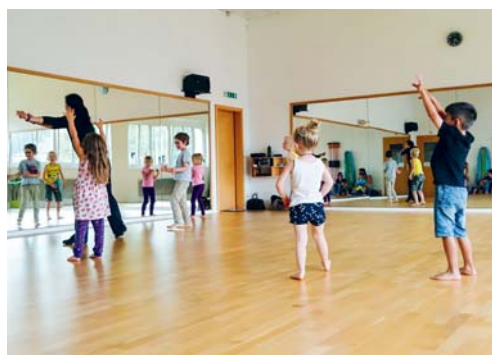
Vor allem der Baditanz kam gut an.