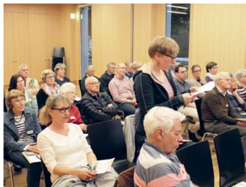
Im Kirchgemeindezentrum wurde über den Stand des Entwicklungsprojektes «Generationenkirche Flawil» informiert.

Die Projektleitung gab einen Einblick in das Konzept und in die bisher entwickelten Ideen und Ergebnisse von Fach- und Arbeitsgruppen. Vorgestellt wurde die Philosophie der Alltagskirche sowie Überlegungen zu Angeboten, Räumen, Finanzen und betrieblichen Aspekten. Schwerpunkt der Alltagskirche ist der Lebens- und Begegnungsraum «im Feld». Hier soll ein «Markt der Interessen» mit verschiedenen Angeboten und Anbietern entstehen. Nach dem Informa-