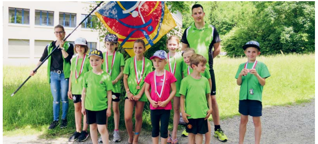
Erfolgreiche Jugis des STV Flawil am Jugitag in Necker.