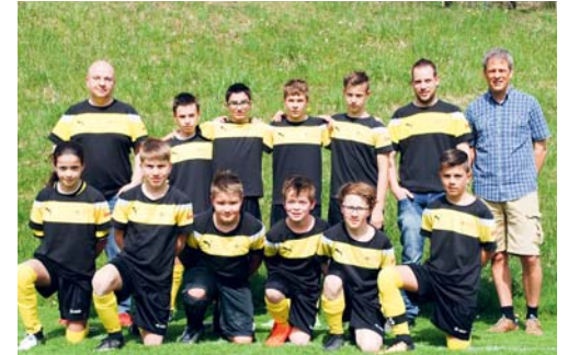
Die D-Junioren mit ihren neuen Einlauftrikots.