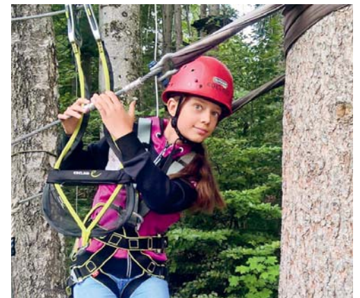
Viel Action in freier Natur: Abenteuer Seilpark.