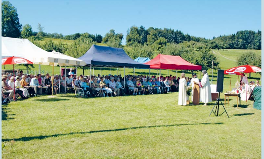
Fronleichnamsgottesdienst – nicht in der Kirche, auch nicht auf einer Wiese.

Der Gospelchor Gossau trägt mit seinen schwungvollen Liedern diesen Gottesdienst mit. Anschliessend an den Apéro gibt es Mittagsverpflegung mit Wurst, Brot und Kuchen.