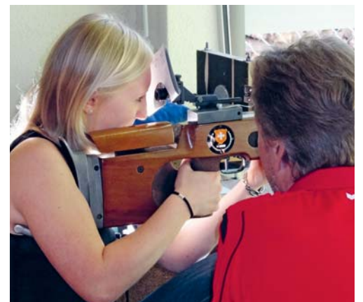
Ein kleiner Vorgeschmack auf den Gruppenplausch 2018.