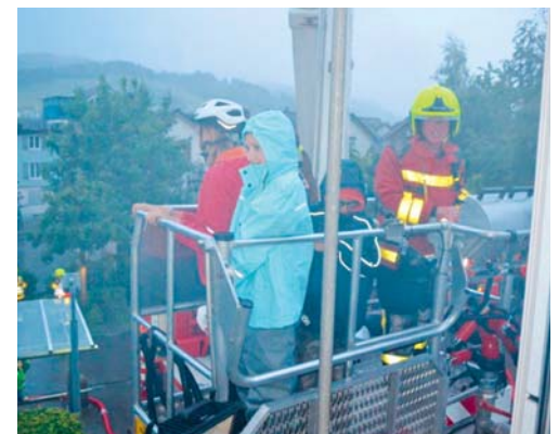
Die Schüler wurden mit dem Hubretter aus ihrem Schulzimmer evakuiert.

Um die Situation realistischer zu machen, wurden Treppenhaus und Gänge mit Übungsrauch gefüllt, sodass die Klasse mit dem Hubretter über die Fenster aus ihrem Schulzimmer evakuiert werden musste: für die Kinder ein beeindruckendes Erlebnis, für die Feuerwehr eine realitätsnahe Übung.