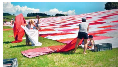
Ohne Auslegen kein Bignik: Je mehr mithelfen, desto mehr Tuchmodule können ausgelegt werden.

Auch das Auslegen ist Teil des Bignik-Erlebnisses. Bignik lebt von der Partizipation. Rund 2700 Tuchmodule sollen ausgelegt werden. Ausgelegt wird das, was ausgelegt werden kann. Je mehr, desto grösser und eindrücklicher das Picknicktuch. Rund 150 Tuchlegerinnen und Tuchleger werden für die diesjährige Auslegung gesucht. Wer Lust auf das Auslegemanöver hat, kann sich unter www.bignik.ch/helfer anmelden.