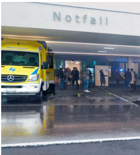
Einladung zu einem interessanten Referat mit Führung.

Der Eintritt zur Veranstaltung ist kostenlos und weder an den Jahrgang noch an parteiliche Sympathien gebunden. Aus organisatorischen Gründen ist eine Anmeldung bis 28. Mai erforderlich, via E-Mail cvp60plus@yahoo.com oder per Telefon 071 911 81 61. Das Parkplatzangebot ist beschränkt. Die Postauto-Linien 725 und 727 halten direkt beim Spital. Mit der Buslinie 704 Richtung Wilerwald fährt man vom Bahnhof Wil bis zur Haltestelle Weidle. Von dort ist das Spital in wenigen Gehminuten zu erreichen. Daniel Leu