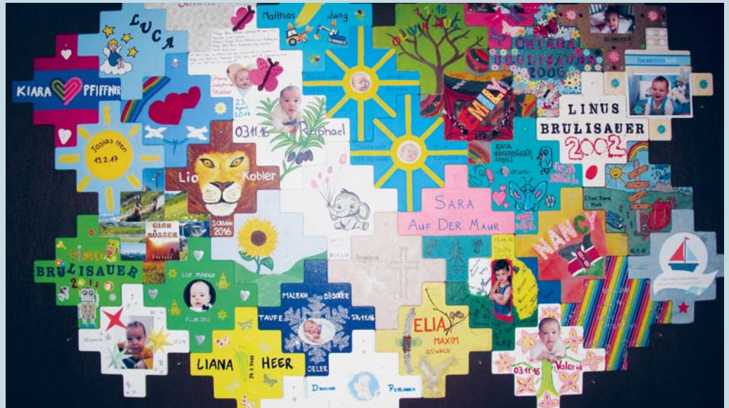
Wand der Taufkreuze

Nach der Taufe hängen diese Kreuze noch für eine gewisse Zeit in den Kirchen, bis sie schliesslich in der sogenannten Tauferinnerungsfeier von den Tauffamilien wieder abgeholt werden. In dieser Feier dürfen die heranwachsenden Kinder mit ihren Eltern dann nochmals ihre Taufkerze anzünden. Ein buntes und lebendiges Treiben herrscht dann im Chorraum in unseren Kirchen. Oft sind die Eltern stark berührt, wenn sie in Erinnerung an die Taufe ihr Kind mit Weihwasser segnen. Vor oder nach der Feier sitzen die Familien zusammen, tauschen sich aus. Die diesjährigen Tauferinnerungsfeiern für Flawil und Niederglatt finden am Samstag, 26. Mai, um 14.30 bzw. 16.00 Uhr statt.