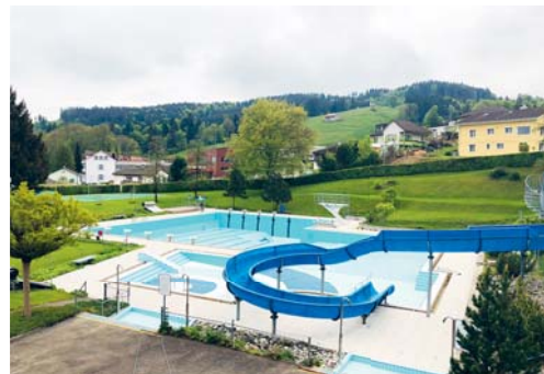
Das Schwimmbad Degersheim wurde durch einen Sicherheitsexperten überprüft.

Die grössten Sicherheitsmankos sah der Sicherheitsexperte nicht bei der Badanlage selber, sondern im Bereich des Kioskes. Bei den dortigen Sitzplätzen verleiten die Absturzsicherungen entweder zum Daraufsitzen oder sie sind gar nicht vorhanden. An der Badeanlage selber wurden eher kleine Dinge bemängelt, die mittlerweile behoben werden konnten. Dabei handelt es sich vor allem um gutes Sichtbarmachen von Treppenstufen, der klaren Abtrennung des Sprungbereiches oder der deutlichen Beschriftung der Rutschbahn und des Sprungturms. Die Sicherheitsvor-