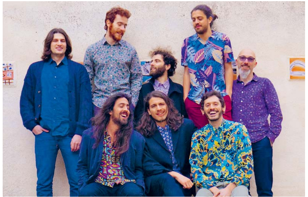
«SuRealistas» im Kulturpunkt Flawil.

VEREIN Heute Freitag geht es im Kulturpunkt mit «SuRealistas» heiss zu und her. Unbändige Fröhlichkeit, heisse Rhythmen und ein gerütteltes Mass an Sentimiento – mit dieser Melange hat die Musik der Südhalbkugel die Welt erobert. «SuRealistas» kreuzen spanische, lateinamerikanische und afro-karibische Traditionen zu einem neuen Ganzen, das von der achtköpfigen Combo in Musik umgesetzt wird und das Publikum zum