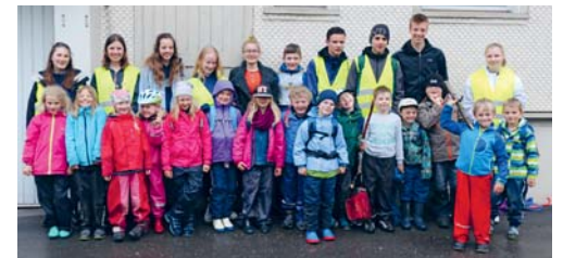
Am Schnuppertag waren 15 Kinder dabei.

Alle Erstklässlerinnen und Erstklässler sind herzlich dazu eingeladen, im Blauring oder in der Jungwacht vorbeizuschauen. Einmal pro Woche treffen sich die gleichaltrigen Kinder und ihre Leiterinnen und Leiter zu einer Gruppenstunde. Die Mädchen haben jeweils am Mittwoch von 18.30 bis um 19.30 Uhr, die Knaben am Dienstag von 18.30 bis 19.30 Uhr Gruppenstunde. Der Treffpunkt ist vor dem katholischen Pfarreiheim in Degersheim. In Wolfertswil treffen sich die Kinder jeweils am Montag um 18.30 Uhr bei der Kirche. Weitere Infos zu den Scharen finden sich unter www.jubla-degersheim.ch . Medea Koller