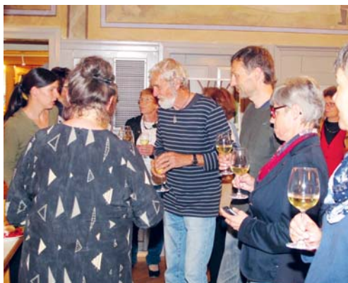
Hospizbegleitende beim jährlichen Treffen.