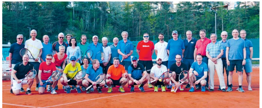
Vereint auf einem Bild: die Trainingsgruppe in Stans in Tirol.

tolles Sporthotel – die Mannschaften trafen optimale Trainingsbedingungen an. In diesem Jahr war der Schwerpunkt das Doppeltraining. Dabei wurde vermehrt der Übergang ans Netz und das Wechseln der Seiten mit seinen verschiedenen Varianten und Absprachen geübt. Nun stehen die Mannschaften bereits mitten im Interclubwettbewerb und versuchen, das Gelernte erfolgreich in die Praxis umzusetzen. eing.