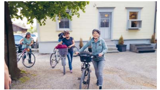
Am diesjährigen Leiterevent wurde geradelt.

VEREIN Vorstandsmitglieder und Leiterteam des STV Flawil trafen sich vor Kurzem zum alljährlichen Leiterevent. Nachdem man sich im vergangenen Jahr beim Bogenschiessen mass, traf sich die sportliche Truppe diesmal zu einer Tour mit dem Bike. Ob E-Bike, Mountainbike oder Citybike spielte dabei keine Rolle, alle hatten das gleiche Ziel und fuhren via Botsberger Riet, Riggenschwil und Bichwil dem Sonnenuntergang entgegen in Richtung Bettenauer Weiher. Während die einen fest in die Pedale traten, um als Erste am Ziel zu sein, genossen andere die herrliche Abendstimmung. Nach kurzer Zeit glitzerte auch schon der Bettenauer Weiher durch die Bäume und Sträucher, man kam dem Ziel näher. Nach einer Verschnaufpause am Weiher traf man sich im Restaurant Schützenhaus zum Znacht, wo jeder sein Fleisch selber zubereitete. Ob vom Rind oder vom Pferd, 200 oder 400 Gramm – überall brutzelte Fleisch auf einem heissen Stein und die Stimmung konnte nicht besser sein. Ein weiterer toller Abend im Kreise der grossen Turnerfamilie. Nachdem sich alle den Bauch vollgeschlagen hatten, hiess es wieder «Helm auf, Licht an und rein in die Pedalen». Die Rückfahrt war allerdings etwas anstrengender als die Hinfahrt. Woran das wohl lag? Heidi Zeller