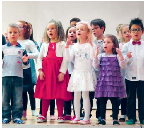
Standen 2016 auf der Bühne: Singgruppe der Musikschule Flawil.