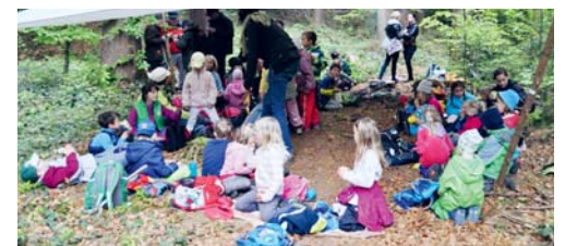
Den internationalen Tag des Waldkindergartens genossen.

Die Zeit verging wie im Flug und schon hiess es, sich mit Gesang vom Wald zu verabschieden. Nochmals herzlichen Dank allen Beteiligten für die spannenden Stunden im Wald. Moni Dreyer