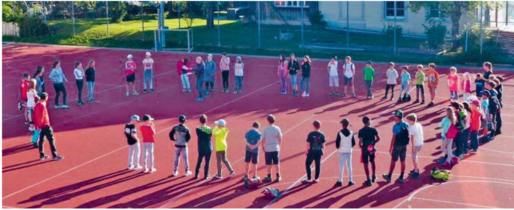
Sondertage sind willkommene Abwechslung im Schulalltag.

DEGERSHEIM In der Woche vor Auffahrt war in den Schulhäusern von Degersheim nichts wie sonst: Anstatt gerechnet und gelesen wurde gebastelt, geturnt, experimentiert, gewerkt und gespielt. Sondertage standen auf dem Stundenplan.