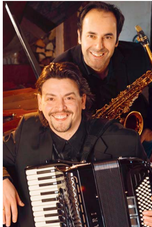
Heute Freitag sind Goran Kovacevic und Peter Lenzin im Kulturpunkt zu Gast.

VEREIN Goran Kovacevic – ihn braucht man ja kaum noch besonders vorzustellen – ist heute Freitag zu Gast im Kulturpunkt. An seiner Seite steht mit Peter Lenzin eine weitere Grösse der Schweizer Musikszene auf der Bühne. Zusammen werden sie einen Abend gestalten, der wie vorangegangene noch eine ganze Weile im Gedächtnis der Zuhörer bleiben wird.