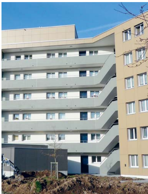
Die vollständig renovierte Alterssiedlung Feld mit Haupteingang und neuem Velo- und Entsorgungsraum.