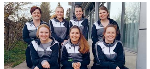
Der aktuelle, zum Teil neu gewählte Vorstand der Damenriege Degersheim.