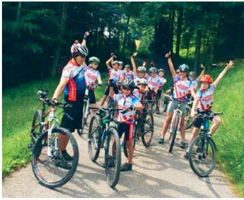
Das Radteam Krüger bietet auch Biken für Kids an.