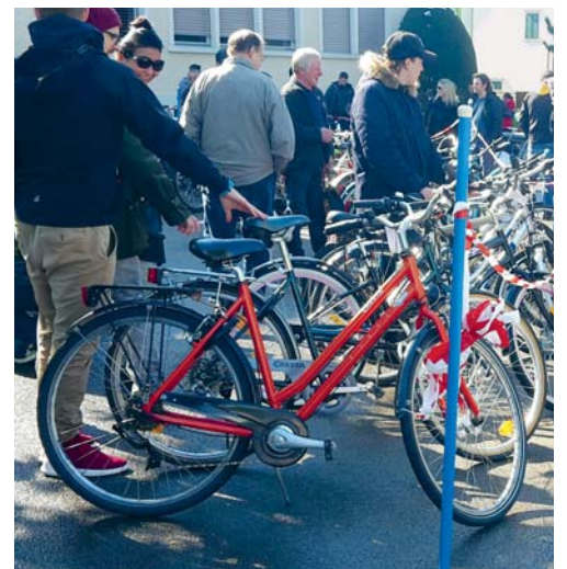
Der Flawiler Velomarkt findet jedes Jahr grossen Zuspruch.