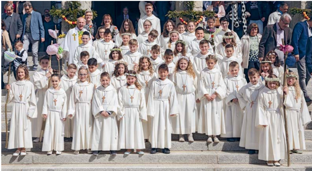
Erinnerung an den grossen Tag.