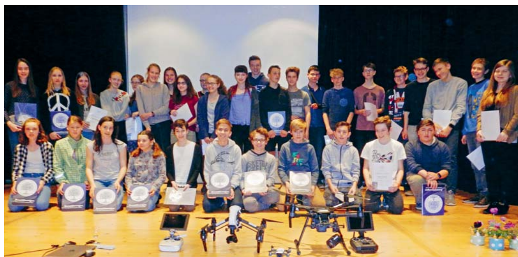
Stolz präsentieren die Jugendlichen ihre Kodex-Auszeichnungen.