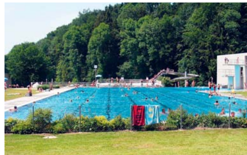
Auch in dieser Saison ist das Freibad Böden täglich von 9 bis 20 Uhr geöffnet.

Sämtliche Informationen sind auch auf der Homepage www.flawil.ch unter der Rubrik «Freizeit → Freibad» zu finden.