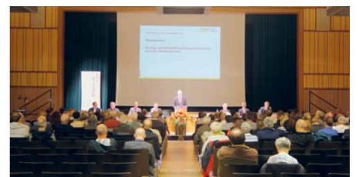
Am Dienstag, 24. April, findet im Lindensaal die Bürgerversammlung statt.

Die Bürgerversammlung findet am Dienstag, 24. April 2018, um 20 Uhr im Lindensaal statt. Als Eintrittsticket dient der weisse Stimmausweis, der Anfang April allen Stimmberechtigten zugestellt wurde. Die Jahresrechnung ist im Geschäftsbericht enthalten, der ebenfalls Anfang April in alle Haushalte verteilt wurde. Sämtliche Unterlagen sowie weitere Details zum Rechnungsabschluss sind zudem auf www.flawil.ch unter der Rubrik «Aktuelles → Dokumentationen» aufgeschaltet.