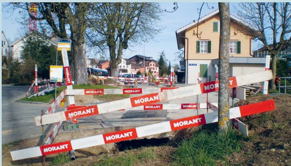
Wie wird er einmal aussehen, wenn alle jetzt offenen Gräben wieder verschwunden sind?

Ohne Fantasie wären wir unfähig, uns in andere Menschen hineinzusetzen, ihr Reden und Handeln zu verstehen, auf ihre Gefühle einzugehen.