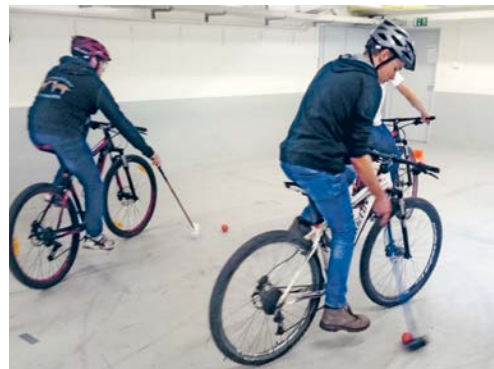
Bei diesem Posten war der Spassfaktor besonders gross: «VeloPolo».

Die Landwirte stellten sich den Herausforderungen mit Bravour und hatten vor allem an den Posten «VeloPolo» und «Begegnung» (mit dem Velokurier) ihren Spass. Mit dem bisher zweitbesten Qualifikationsergebnis der Schulen beziehungsweise dem viertbesten Klassenergebnis an