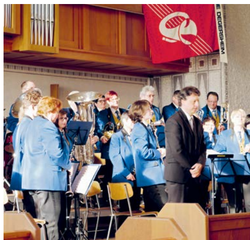
Der Musikverein Degersheim hatte zum speziellen Konzert geladen.