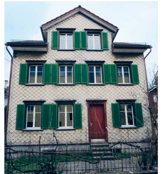
An der Neugasse 10 steht ein typisches Stickerhaus.

plan Stickerquartier sind auf www.flawil.ch unter der Rubrik «Aktuelles → Projekte → Neugasse 10» abrufbar.