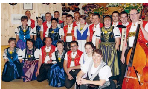
Die Trachtengruppe Degersheim organisiert die Delegiertenversammlung der St.Galler Trachtenvereinigung.