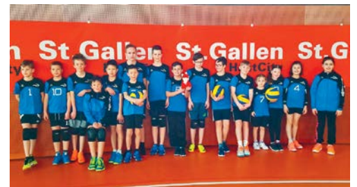
Volley Flawil nahm erfolgreich an der Mini-Finalrunde in St.Gallen teil.