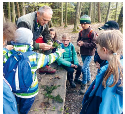
Eine der beliebten Ferienplausch-Aktionen ist die Tour mit dem Förster im Rehwald.