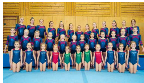
Kleine und grössere Kunstturnerinnen trainieren regelmässig beim TZFF.