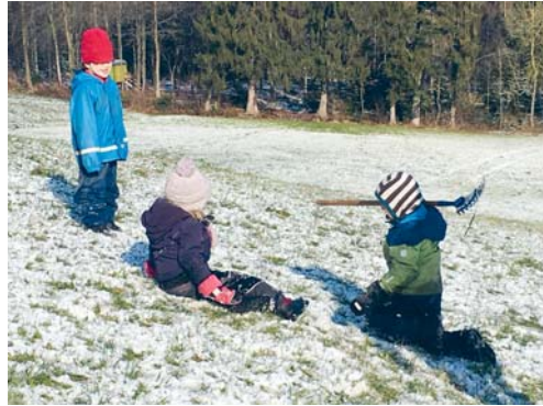
Bei nahezu jeder Witterung sind die Kinder in der freien Natur.

Derzeit und noch bis Mitte März läuft die Anmeldefrist für den Waldkindergarten. Die Anmeldung erfolgt über das offizielle Formular zur Anmeldung in den Kindergarten (Eintrittsformular 1. Kindergartenjahr). Dort können die Eltern zwischen dem Waldkindergarten und dem Hauskindergarten wählen. Das Formular wurde von der Schulverwaltung Ende Januar verschickt.