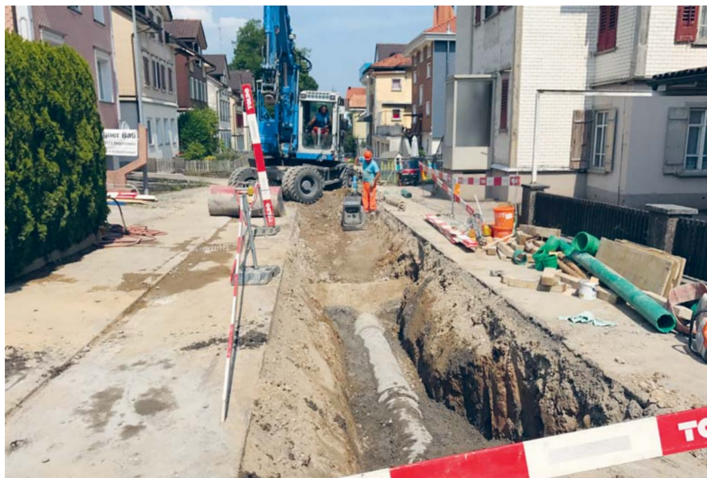
Die Investitionsprojekte in Degersheim kosteten im Jahr 2017 weniger als vorangeschlagen.

DEGERSHEIM Im Jahr 2017 konnten in der Gemeinde Degersheim insgesamt vier Investitionsprojekte in den Bereichen Strassen-, Wasserleitungs- und Kanalisationsbau abgeschlossen und abgerechnet werden. Bei allen vier Projek-