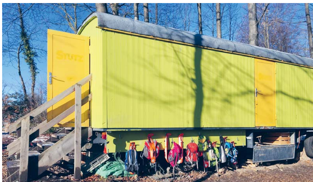
Der stationäre beheizbare Bauwagen dient als Garderobe und Materialdepot.

FLAWIL Was einst als Pilotprojekt begann, ist längst zu einem festen Bestandteil geworden und nicht mehr aus dem Flawiler Schulangebot wegzudenken: der Waldkindergarten im Rehwald. Auch heute noch ist der Waldkindergarten in Flawil das einzige öffentliche Angebot dieser Art im Kanton St.Gallen. Derzeit läuft die Anmeldefrist für das kommende Schuljahr.