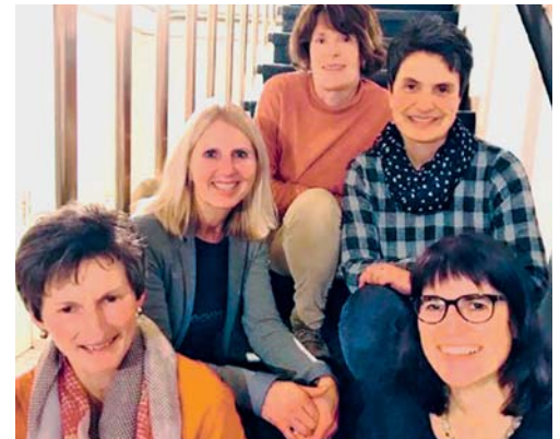
Der Vorstand des Damenturnvereins Flawil.