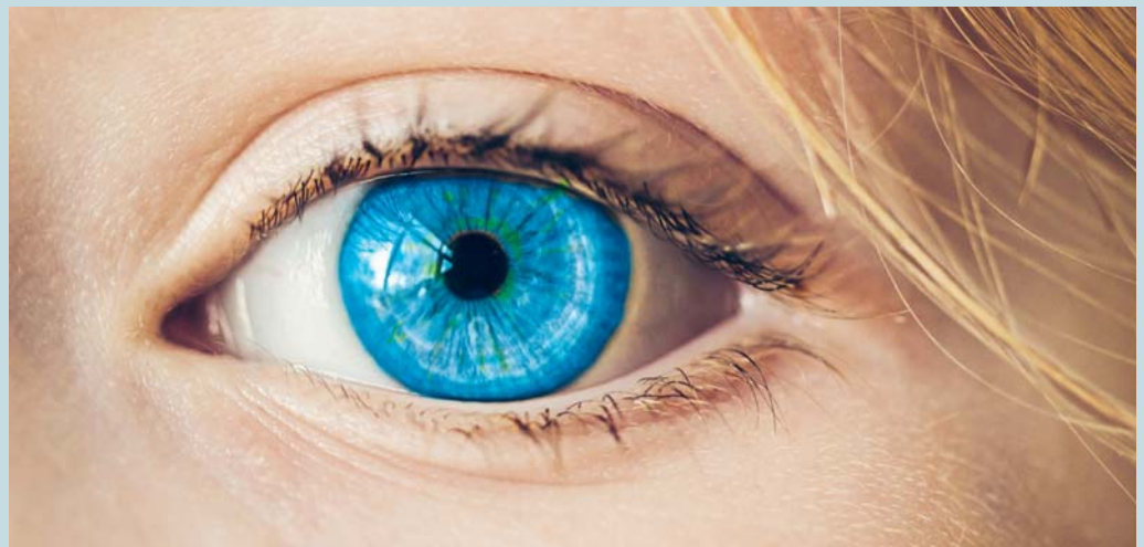
«Was willst du, dass ich für dich tue?» – «Ich will sehen!»

Was hat der Werdegang eines Mannes, der sich Gottes Sohn nannte und freiwillig für uns in den Tod ging, mit unserem Leben zu tun? Für einige bleibt dies wesentlich, für viele geht dies in der vollgestopften Agenda total unter. Um von der Informationsflut nicht überschwemmt zu werden, nehmen wir darum selektiv wahr. Vor allem nehmen wir wahr, was uns und unseren Interessen dient. Wir sehen oft das, was wir sehen wollen. Das andere übersehen wir. Wer noch nie ein Erlebnis mit Gott hatte, hat Mühe zu erkennen, was ihm Christi Liebe bringen kann. Er knüpft an nichts an, stellt keine Zusammenhänge her zwischen dem Glauben und seinem eigenen Leben.