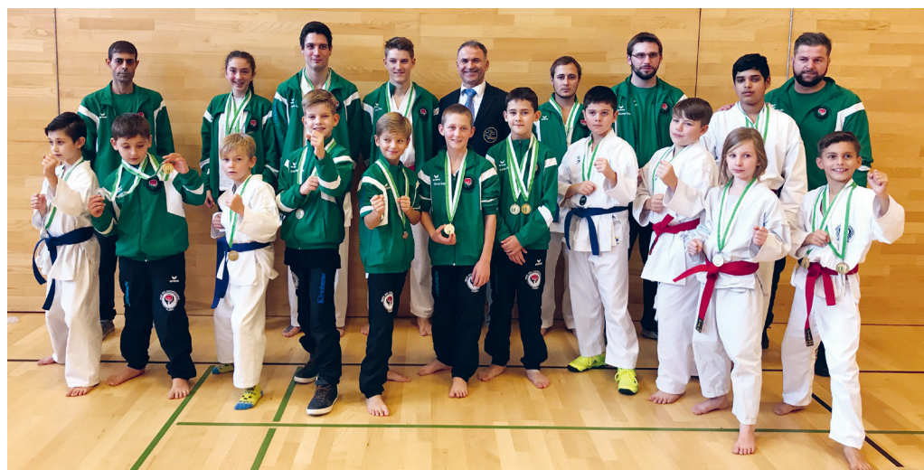
Die siegreichen Flawiler Karatekas.