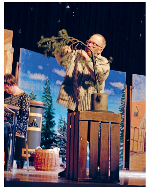
Die Bewohner der Stiftung Sântisblick führten für die Degersheimer Senioren ein Theaterstück auf.

VEREIN Jedes Jahr erfreuen die Bewohner der Stiftung Sântisblick die Degersheimer Senioren. Dieses Jahr führten 14 Schauspieler einen Einakter auf. Das Stück handelte von einer armen Familie ohne Hoffnung auf einen Weihnachtsbaum. Doch sie erhielten den schrägsten, zerzausten Baum, den niemand kaufen wollte, als Geschenk. So wich die Traurigkeit und ihre Herzen wurden mit Freude erfüllt.