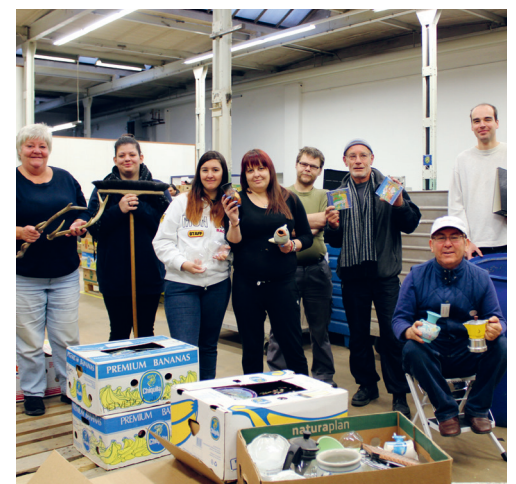
Das Brockenteam in der neu eingerichteten Warenannahme.