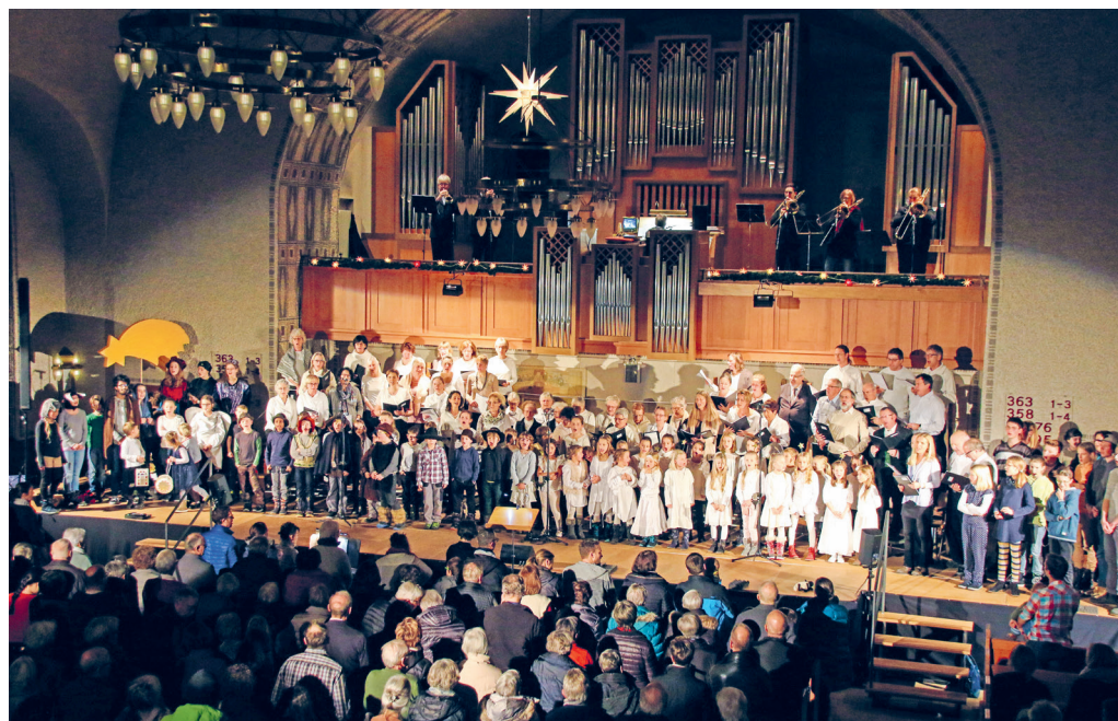
Rund 140 Erwachsene und Kinder führten gemeinsam das Musical «Zähler Wiehnacht» auf.

Schulkinder der 1. und 2. Primarklasse und Musikanten, die Theaterspielenden und ein 10-köpfiges Kernteam vollendeten dieses Generationenprojekt. Insgesamt standen bei diesem Singspiel ca. 140 4- bis 83-jährige Mitwirkende auf der kirchlichen Bühne. Dieses bekannte musikalische Krippenspiel, geschrieben von Paul Burkhard in den 60er Jahren, brachte die frohe Botschaft von der Geburt Jesu Christi in traditioneller Weise klar und bestimmt in die Herzen aller Besuchenden.