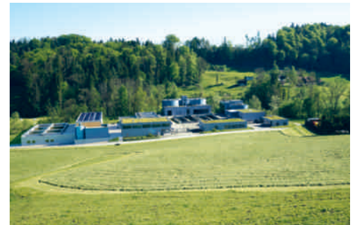
Die ARA Oberglatt, wie sie nach der Erweiterung aussehen soll.

Der Anteil der Gemeinde Degersheim an die Investitionskosten beläuft sich nach Abzug der Bundessubventionen auf 1,24 Millionen Franken. Da der Bund seine Subventionen aber erst zusichert, wenn alle Verbandsgemeinden ihre Kredite zugesprochen haben, muss die Gemeinde Degersheim einen Beitrag in der Höhe von 2,31 Millionen Franken zusichern. Gemäss Gemeindeordnung müssen neue Ausgaben in dieser Höhe von der Bürgerschaft genehmigt werden. Das betreffende Geschäft wird der Degersheimer Bürgerschaft an der Bürgerversammlung vom 26. März 2018 vorgelegt.