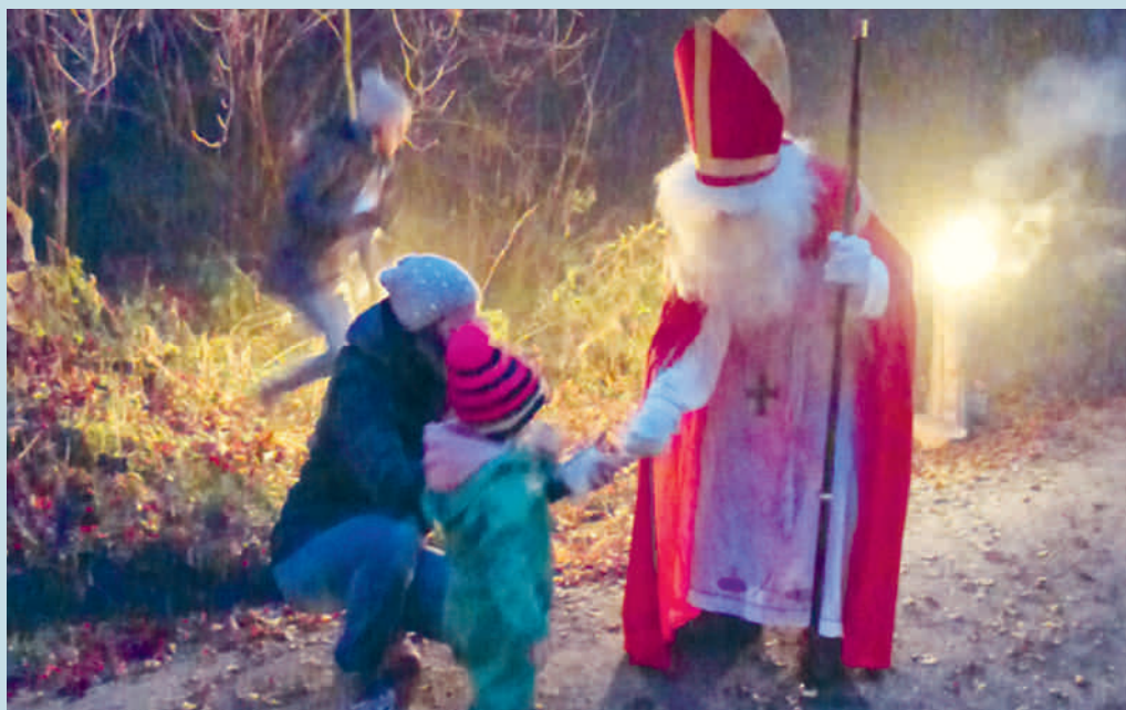
Morgen Samstag besucht der Samichlaus die Kinder im Rehwald.

Ihr Frauen des Familientreffs engagiert euch ehrenamtlich für diese Aufgabe, ich möchte euch an dieser Stelle ganz herzlich für euren Einsatz