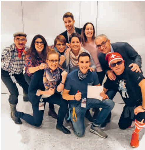
Das junge OK freut sich, dass es losgeht.