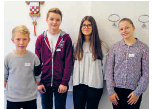
Zu Besuch auf der Gemeindeverwaltung.

FLAWIL Immer im November bietet sich den Schülerinnen und Schülern der Oberstufe Flawil jeweils die Möglichkeit, an einem Vormittag bei einem Lehrbetrieb reinzuschauen. Vier Oberstufenschülerinnen und -schüler besichtigten kürzlich im Rahmen dieser Berufserkundung die Gemeindeverwaltung.