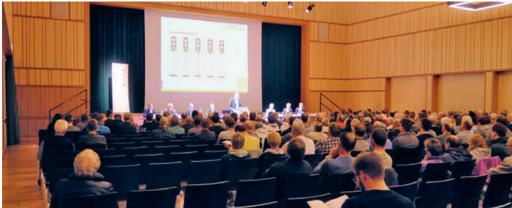
251 Stimmberechtigte nahmen an der Bürgerversammlung teil.

FLAWIL Die Flawiler Stimmberechtigten haben an der Bürgerversammlung vom Dienstag, 28. November 2017, im Lindensaal nicht nur über das Budget und den Steuerantrag 2018, sondern auch über das Gutachten «Entwässerungssystem/Doppelstockkanal Töbeli» entschieden. Sie folgten dabei den Anträgen des Gemeinderates.