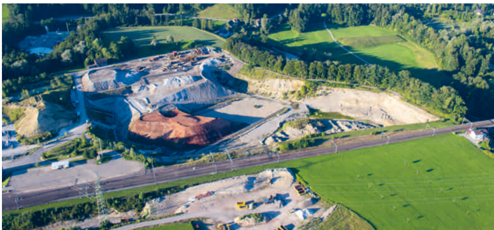
Die Deponie Burgauerfeld aus der Vogelperspektive.

FLAWIL Im Rahmen ihrer ordentlichen Versammlung haben die Delegierten des Zweckverbandes Abfallverwertung Bazenheid (ZAB) einem Kredit für den Ausbau der Deponie Burgauerfeld in Flawil zugestimmt.