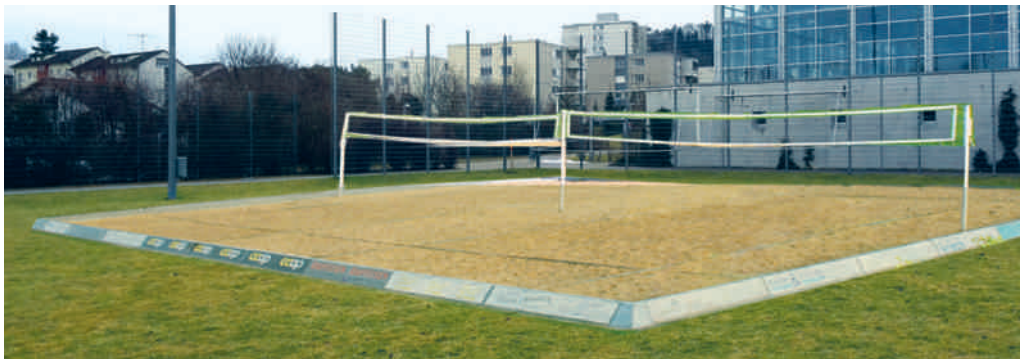
Visualisierung des geplanten Doppel-Beachvolleyballfelds.

FLAWIL Volley Flawil möchte seit längerem ein Doppel-Beachvolleyballfeld realisieren. Dieses soll nördlich der Dreifachturnhalle Botsberg auf der Schul- und Sportwiese erstellt werden. Nun liegt das Baugesuch vom 4. Dezember bis 18. Dezember 2017 öffentlich auf.