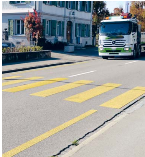
Beim Fussgängerübergang Lindenstrasse erfordert das tägliche Verkehrsaufkommen unter anderem eine Fussgängerschutzinsel.

Der Gemeinderat begrüsst das Vorprojekt und will, dass dieses rasch weiterbearbeitet wird. Aus Sicht des Rates ist eine Verbesserung der Situa-