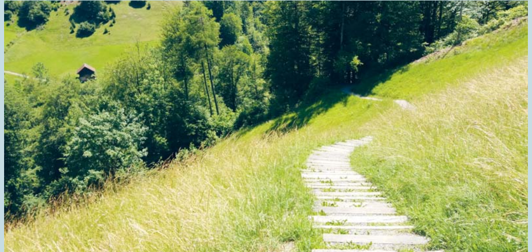
Unterwegs in den Ranft hinunter...