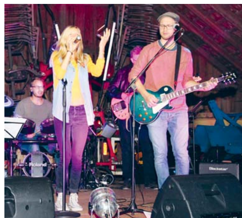
Die Band «Jericho.system» begleitete den Gottesdienst mit rockigen Liedern.