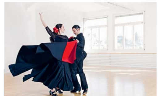
Die Besucher erwartet Leidenschaft, Eleganz, Freude am Tanzen und viel Alegría.

VEREIN Der spanische Club bietet am Samstag, 2. September, für ganz Flawil spanische Spezialitäten und kulturelle Leckerbissen an. Ursprünglich im Untergeschoss der katholischen Kirche Flawil beheimatet, ist das «Centro» heute besser bekannt als «Der Spanier» an der Mühlegasse. Der Verein feiert in diesem Jahr sein erstes halbes Jahrhundert. Dabei gibt es nicht nur kulinarische Gaumengenüsse, sondern auch kulturelle Leckerbissen aus den verschiedenen Regionen Spaniens. Am Samstag, 2. September, wird das spanische Dorf «Pueblo Español» ab 11 Uhr auf dem Parkplatz der Firma SFS (vis-à-vis Centro Español) zum Leben erweckt. Das 50-Jahr-Jubiläum steht allen Flawilerinnen und Flawilern offen – ganz im Sinn des Vereinszwecks. eing.