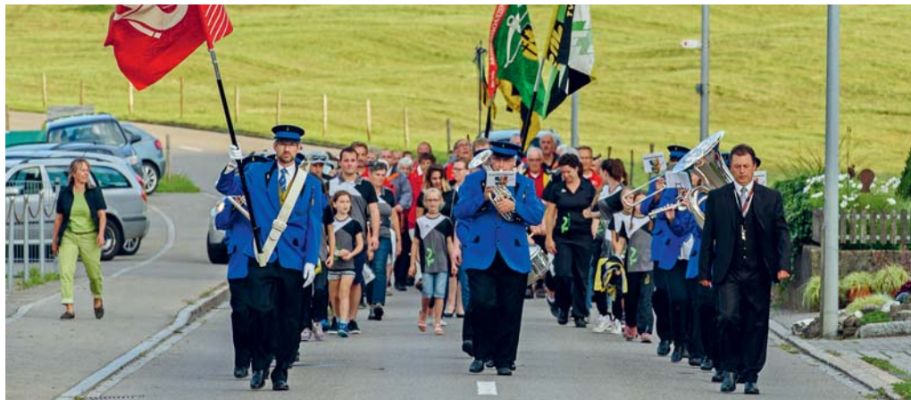
Die erfolgreichen Vereine wurden vom Musikverein Harmonie zum Festplatz geführt.