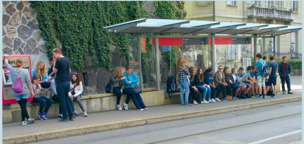
Im kommenden Jahr werden 28 Konfirmandinnen und Konfirmanden unterrichtet.

Religion prägt das öffentliche Gespräch. Kopftücher und Kreuze im Schulzimmer werden diskutiert. Ein Importverbot für jüdisches und muslimisches Fleisch nach ritueller Schlachtung wird geprüft. Die Politik nimmt damit Einfluss auf die religiöse Essenspraxis zweier anerkannter Religionsgemeinschaften, der Juden und der Muslime. Oft wird Religion ausserdem als extremistisch und fundamentalistisch dargestellt und als schädlich und gefährlich wahrgenommen. Negative Schlagzeilen beeinflussen die öffentliche Meinung erheblich. Deshalb ist Religion längst keine Privatsache mehr.