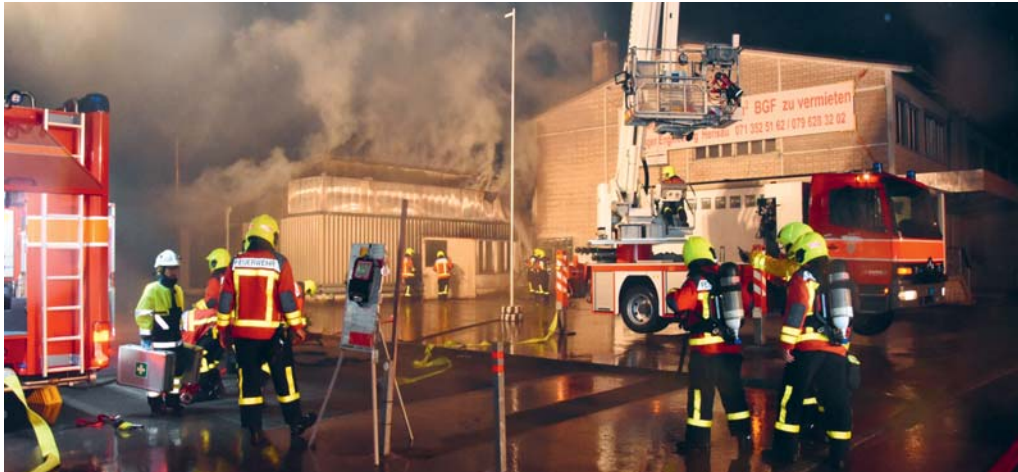
Die Feuerwehr brachte den Brand schnell unter Kontrolle.

FLAWIL/DEGERSHEIM Bei Notruf 118 leistet die Feuerwehr unverzüglich Hilfe. Die Feuerwehren Flawil und Degersheim sind eingebettet in den Sicherheitsverbund Region Gossau (SVRG). Das FLADE-Blatt publiziert quartalsweise die Liste der Einsätze der beiden Feuerwehren.