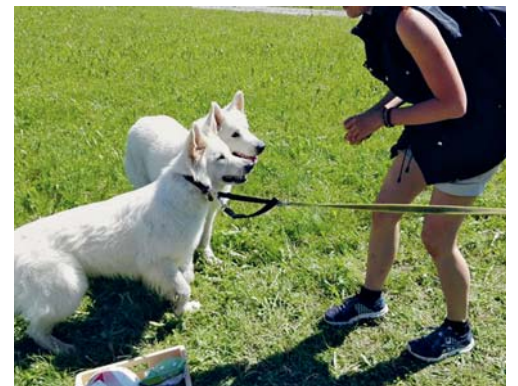
An acht Post warten Aufgaben und locken Mensch und Hund zum unbeschwernten Miteinander.

VEREIN Der Hundesportplausch Bubental lädt alle Hundehalter zur Wanderrallye ein, und zwar auf Samstag, 12. August. Die Strecke beträgt etwa fünf Kilometer, der Start ist von 15 bis 17 Uhr möglich. Start und Ziel sind auf dem Vereinsgelände Bubental bei Flawil. Es besteht Leinenpflicht. Trinkhalt auf der Strecke; der nicht kinderwagentaugliche Weg führt über Wiesen und durch schattige Wälder.