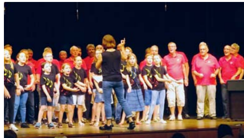
Gemeinsamer Auftritt: der Chor der Musikschule Flawil mit dem Männerchor Eintracht.

der Männerchor Eintracht sowie als Gastformation der Chor der Musikschule Flawil. Während gut zweieinhalb Stunden boten sie dem musikbegeisterten Flawiler Publikum einen beschwingten Abend und nutzten die Möglichkeit, ihr Repertoire zu präsentieren. eing.