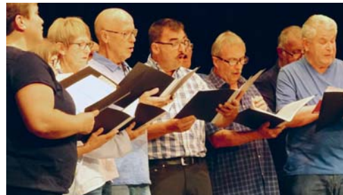
Der Organisator des Anlasses: der Gemischte Chor Egg bei seiner Darbietung.