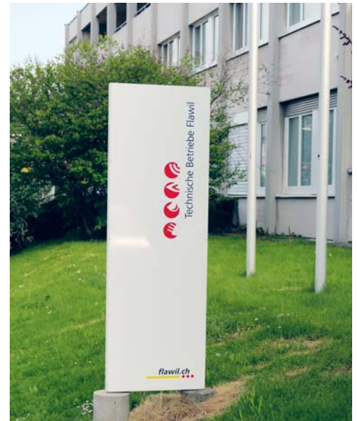
Auch die Technischen Betriebe Flawil haben sich zu 30 Prozent Biogasabsatz bis zum Jahr 2030 bekannt.

Auch die Technischen Betriebe Flawil und die Energiestadt Flawil haben sich zu 30 Prozent Biogasabsatz bis zum Jahr 2030 bekannt. In einem ersten Schritt in diese Richtung erhöhen die Technischen Betriebe Flawil den Biogasanteil in den Heizgasprodukten von fünf auf zehn Prozent. Damit macht sich Flawil auf den Weg in die Energiezukunft.