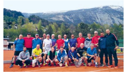
Gruppenbild vor Tiroler Bergkulisse.