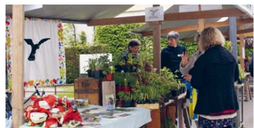
Am Stand des Naturschutzvereins Flawil am Frühjahrsmarkt präsentierten sich die Falkenkinder mit selbstgemachten Produkten.