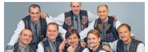
Das «Orpheus-Oktett» gastiert in Flawil.