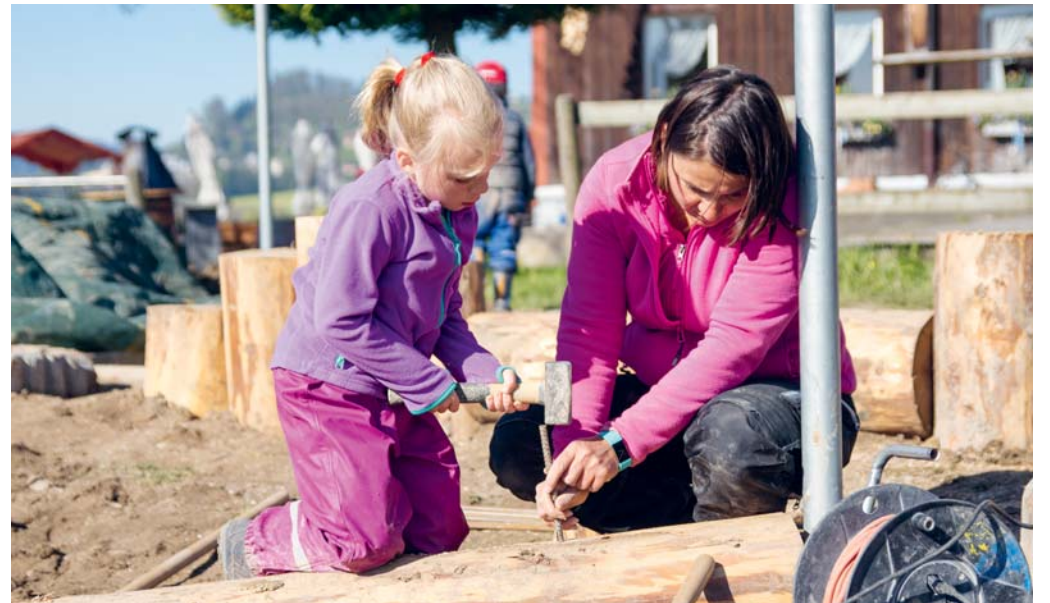
Kindergartenkinder und Eltern arbeiten zusammen an der Pausenplatz-Gestaltung.