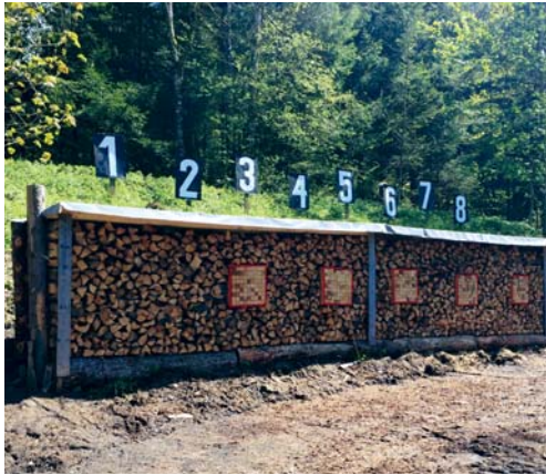
Bei der Instandstellung des Kugelfangs bei der Schiessanlage Giren war der Zivilschutz behilflich.