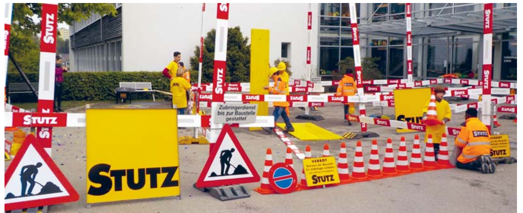
Mit echtem Baustellenmaterial in echten Bauarbeiterkleidern.