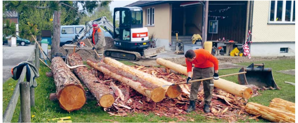
Angehörige des Zivilschutzes schälen die Bäume, die für die Neugestaltung des Pausenplatzes beim Kindergarten Egg verwendet werden.

um es mit den Worten des Zivilschutzkommandanten zu sagen: «Für uns sind solche «Baustellen» gute Übungsanlagen. Zudem kann nach dem Training der Mannschaft und des Kadets auch noch etwas Handfestes und Nachhaltiges bestaunt werden.» Das sei für die Angehörigen des Zivilschutzes sehr motivierend und sinnvoll, sagt Stefan Kramer.