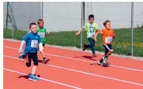
Sie gaben alles, auch wenn Mitmachen wichtiger war als Siegen.