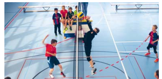
Manche wagten es, auch gegen bereits erfahrene Kinder von Volley Flawil zu spielen.