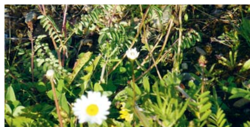
Ein Schultag in der Natur macht nicht nur viel Spass, sondern ist auch lehrreich.

SCHULE Unter diesem Motto erlebten die Enzenbühl-Schulkinder bei strahlendem Frühlingswetter einen lehrreichen Projekttag. Ob bei den Amphibien im Espel, im Bienenhaus des Mattenhofs, mit dem Förster im Rehwald beim Vögel-Beobachten, bei den Eseln und Wildbienen im Botsberger Riet, beim Unkraut-Jäten im verwilderten Schulhausgarten oder beim Frühlings-sirup-Kochen – den Mitgliedern des Flawiler Natur- und Vogelschutzbundes und weiteren Fachpersonen gelang es, die Schülerinnen und Schüler für die faszinierenden Vorgänge in der erwachenden Natur zu begeistern. Sportliche Fünft- und Sechstklässler erfuhren im wahrsten Sinne des Wortes den Frühling mit den Mountainbikes auf Singletrails. Ein Vormittag ohne Stundenplan – so macht Lernen Spass! Edith Bechtiger