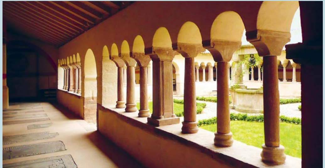
«Bescheidenheit und Genügsamkeit» sollen wieder mehr Bedeutung bekommen.

Entziehen wir uns dem Sog einer Welt voller Sensation und Show. Ziehen wir uns zurück in die Stille. Denn nur sie verheisst uns innere Zufriedenheit. Sagen wir auch mal: «Nein, das muss ich nicht haben. Ich habe genug mit dem, was ich bereits besitze.»