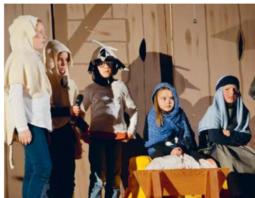
In der evangelischen Kirche gelangte ein tierisches Weihnachtsmusical zur Aufführung.