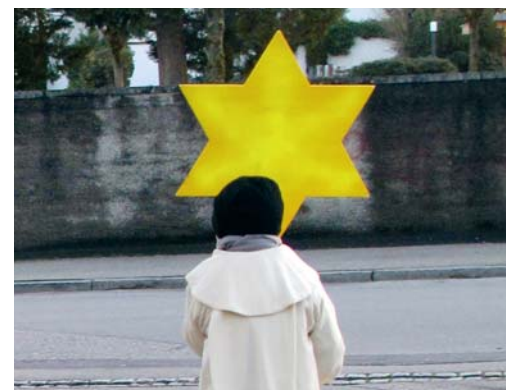
Ab dem 9. Januar bringen die Sternsinger wieder den Segen in die Häuser des Dorfes.