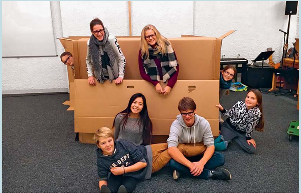
Eine etwas andere Weihnachtsgeschichte.

Das Weihnachtsspiel der Teenager und Kinder fragt danach, was passiert, wenn die Krippenfiguren wieder verpackt werden. Wie kann die frohmachende Botschaft, dass Gott seinen Sohn gab, während des Jahres im Alltag des Einzelnen Gestalt gewinnen? Die Antworten sind vielfältig: Mit denen teilen, die es nötig haben. Frieden ma-