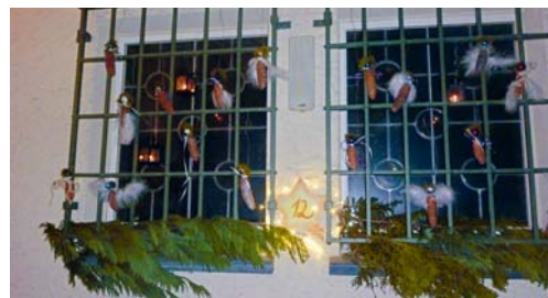
Kaum fertig, erstrahlte es auch schon.