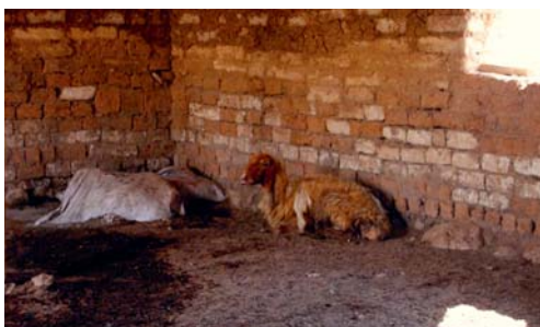
Noch ist der Stall leer...