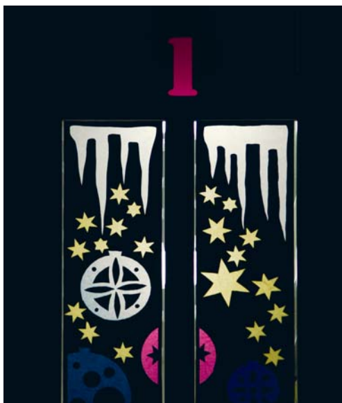
Jeden Tag leuchtet am Enzi-Schulhaus eines der liebevoll gestalteten Adventsfenster mehr.