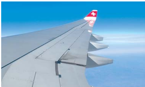
Eltern von Teenagern sind zu ganz speziellen «Flugstunden» eingeladen.