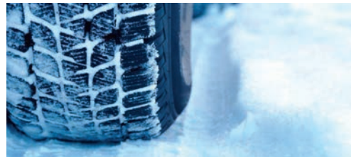
Mit guten Winterreifen schützen Sie sich selbst und auch andere Verkehrsteilnehmer.