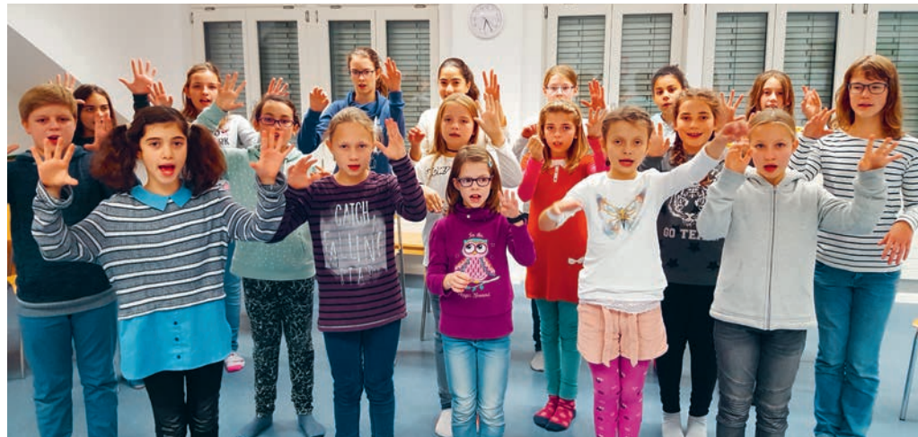
Der Kinderchor 2 und der Jugendchor laden zum gemeinsamen Singen ein.