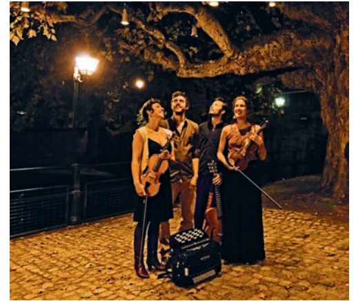
«Zakouska» aus Frankreich: witzig, musikalisch gekonnt und mit beeindruckender Bühnenpräsenz.