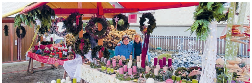
Die Ruhe vor dem (An-)Sturm.