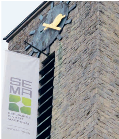
An den Türmen der vier Kirchen zeigten die Fahnen das neue Logo.