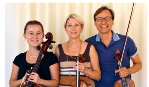
Das Streichtrio wird an der Adventsmatinee seine Zuhörer zum Innehalten und Geniessen verleiten.