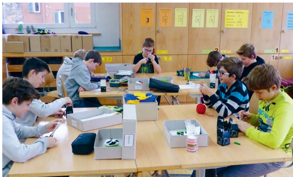
Die Primarschülerinnen und Schüler bastelten während der Aktionswoche kleine Geschenke.

Anzutreffen sind wir auf dem Dorfplatz, bei der Post oder vor der Migros in Degersheim.