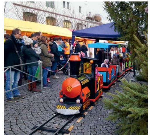
Für die kleinen Weihnachtsmarktbesucher war die Eisenbahnfahrt der Höhepunkt.

VEREIN Schon ist er wieder Geschichte, der Weihnachtsmarkt auf dem Dorfplatz in Degersheim. Das OK Weihnachtsmarkt bedankt sich an dieser Stelle ganz herzlich bei den vielen Besuchern. Die leuchtenden Kinderaugen während der Eisenbahnfahrt, die herzlichen Applause für die Darbietungen der verschiedenen Vereine und natürlich die vielen netten Gespräche und Komplimente waren dem OK Entschädigung für seine Aufwendungen. Es war eine grosse Freude, diesen Anlass für die Bevölkerung zu organisieren und so können sich Jung und Alt bereits jetzt auf den nächsten Weihnachtsmarkt freuen. Unter www.weihnachtsmarkt-degersheim.ch finden Sie in Zukunft viele nützliche Informationen rund um diesen Anlass. Die Planung für den nächsten Weihnachtsmarkt rollt bereits wieder an, sollte also jemand Anregungen, Wünsche, Standreservierungen oder andere gute Ideen bereithaben, melde er sich unter E-Mail eggenberger@gartenheini.ch . OK Weihnachtsmarkt