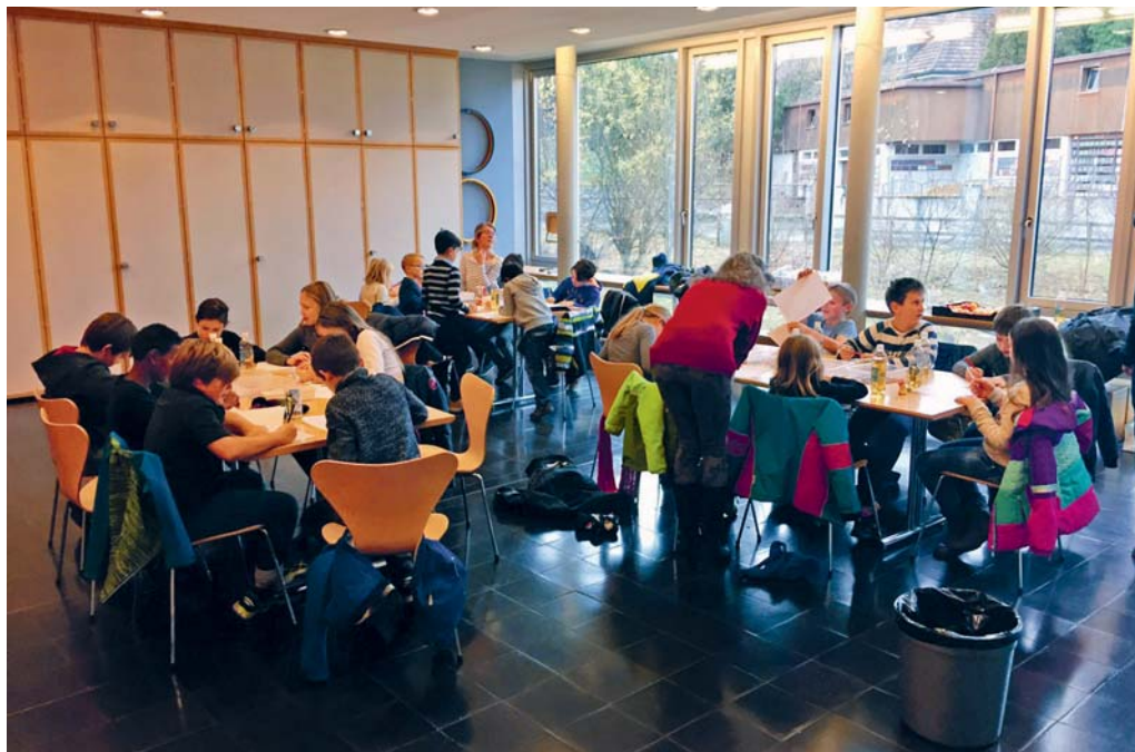
Mit Enthusiasmus bei der Sache: Die Kinder bringen ihre Wünsche und Ideen zu Papier.

Noch ausstehend ist der dritte Workshop für Jugendliche ab zwölf Jahren, der in Zusammenarbeit mit der Offenen Jugendarbeit OJA ausgeschrieben wird. Dieser ist noch nicht terminiert. Um die Arbeit des dritten Workshops nicht zu beeinflussen, wird vorerst keine Auswertung der Ideen und Wünsche der Kinder und Erwachsenen vorgenommen.