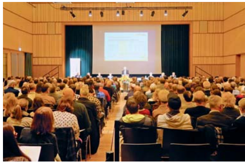
Bürgerversammlung im Flawiler Lindensaal

FLAWIL Die Flawiler Stimmberechtigten haben am vergangenen Dienstag an der Bürgerversammlung im Lindensaal nicht nur über das Budget und den Steuerantrag 2017, sondern auch über drei Projekte entschieden. Bei sämtlichen Traktanden folgte die Bürgerversammlung den Anträgen des Gemeinderates.