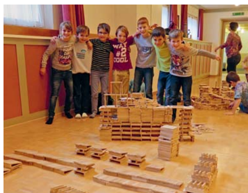
Kreativ und einfach, unterhaltsam und gemeinsam: Das «Kapla-Bauen» machte allen Spass.