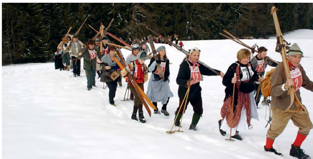
Mit geschulterten Skis wird der Eppenberg erklommen.