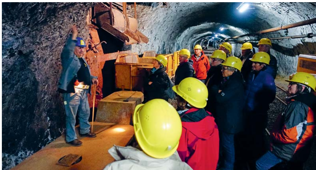
Die Ausflügler folgen aufmerksam den Geschichten des Begleiters.