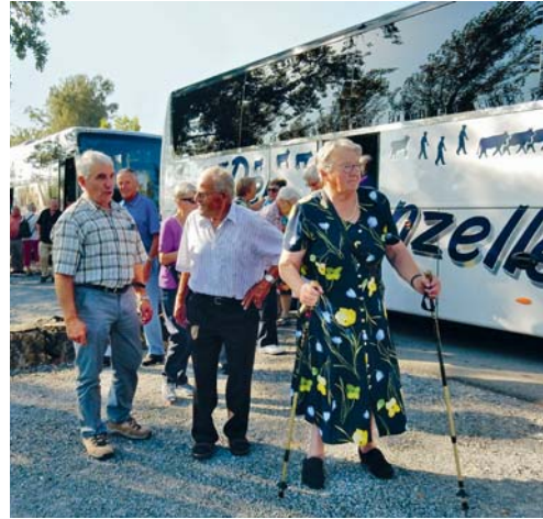
Beim Kaffeehalt im Rohrspitz.