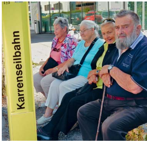
Warten auf die Karrenbahn.