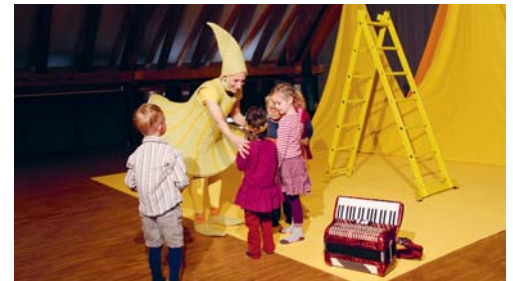
Das Theater «Pfunggeli» bietet kulturell wertvolles Erlebnis für die ganze Familie.

Gelb, gelb und nochmals gelb: Die Sonnenzwerge leben in einer warmen, leuchtenden Welt. Beim interaktiven Stück werden die Kinder immer wieder eingeladen mitzuspielen. Trotz dem Kauderwelsch der Zwergensprache verstehen alle, um was es geht: Tonfall, Gestik und die Körpersprache der zwei Schauspieler sagen genug. Weitere Infos unter www.doktoreisenbarth.ch . eing.