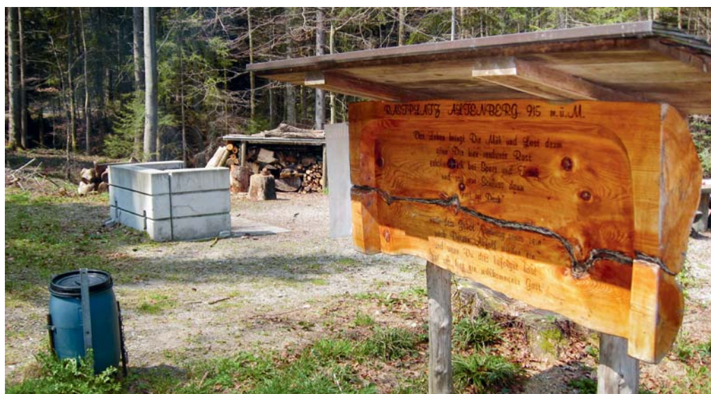
Grillstelle im Altenberg

DEGERSHEIM Degersheim bietet viele Möglichkeiten, die Freizeit mit Sport und Erholung zu verbringen. Auch Geist und Seele kommen nicht zu kurz. Eine Wanderung quer durch die Gemeinde zeigt.