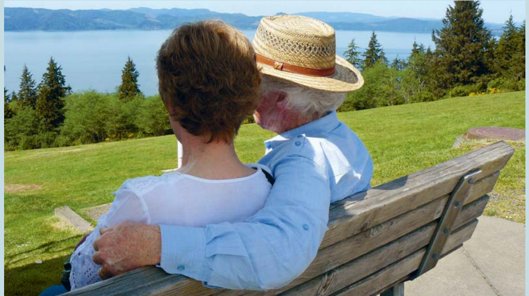
Älter werdende Eltern stehen im Zentrum des Themenabends.

Gemeinsam gehen wir der Frage nach, welche Herausforderungen, Freuden, Freiheiten, Widerstände, Erleichterungen, Frustrationen ... die Eltern und die erwachsenen Kinder in diesem Lebensabschnitt erleben und wie sie damit umgehen.