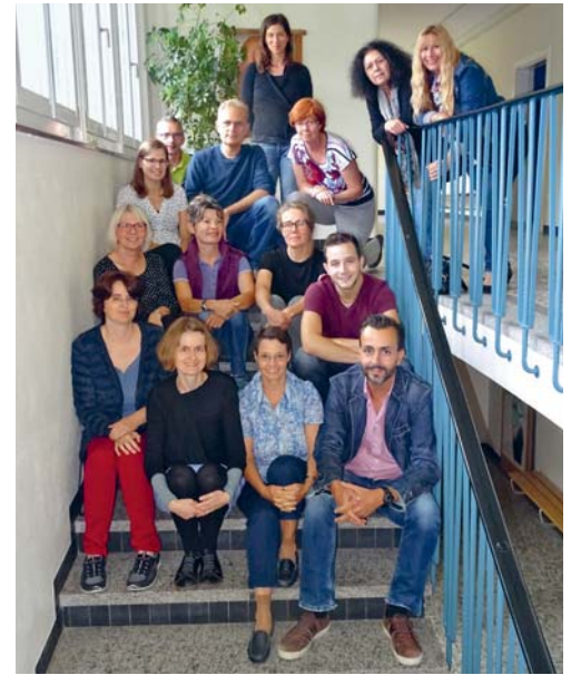
Lehrpersonen der Musikschule Degersheim

Für die Arbeit zur Schul- und Qualitätsentwicklung sowie für die Gestaltung des Musikschuljahres trifft sich das Team der Musikschule im Laufe eines Schuljahres zu zwei Semesterkonferenzen, die jeweils an einem Samstagmorgen stattfinden. An der letzten Konferenz vom 17. September 2016 wurde als Schwerpunkt das Programm für das 40-Jahr-Jubiläum im Jahr 2017 besprochen. Die Musikschule möchte das Können der Musik-