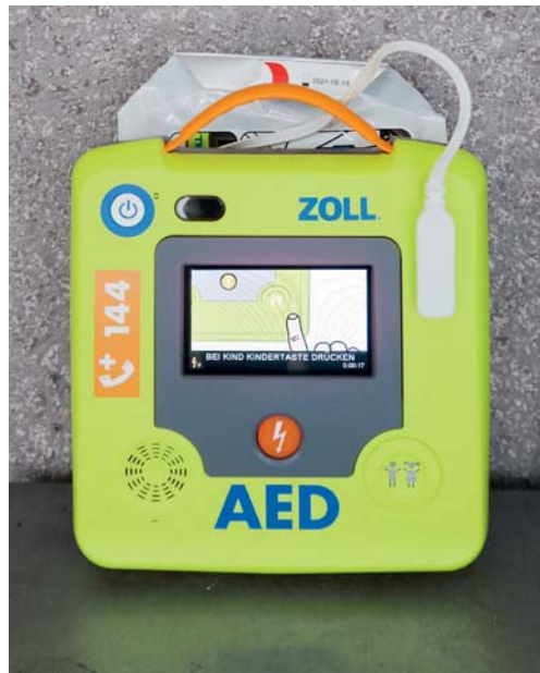
Das Gerät weist Helfer Schritt für Schritt an.

Der Defibrillator ist ein Gerät, das durch gezielte Stromstösse Herzrhythmusstörungen wie Kammerflimmern beendet. Fast allen plötzlichen