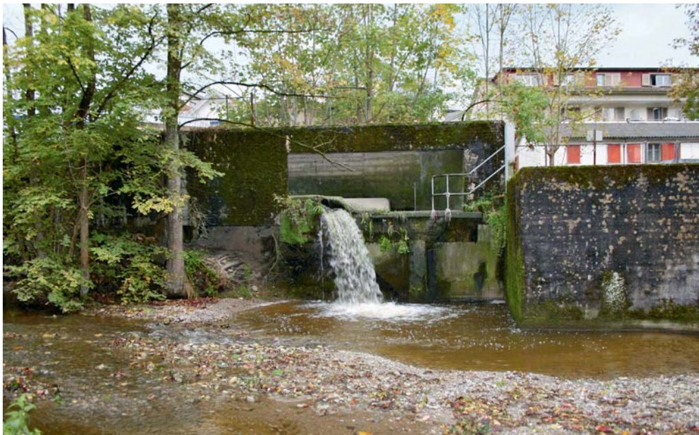
Umfassend überarbeitet und ergänzt: das Projekt «Sanierung Entwässerungssystem Töbeli».

Die übrigen Bestandteile des bisherigen Projekts (Regenbecken) haben sich praktisch nicht verändert.