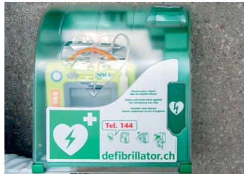
Auch beim Gemeindehaus hängt vor dem Haupteingang ein grüner Kasten mit einem Defibrillator.

Herzoden geht ein Kammerflimmern voraus. In solchen Situationen zählt jede Minute. Denn: Mit jeder Minute nimmt die Überlebenschance um zehn Prozent ab. Deshalb gibt es Defibrillatoren nicht nur in Krankenhäusern und in Rettungswagen, sondern auch an öffentlichen Standorten – wie jetzt auch in Flawil.