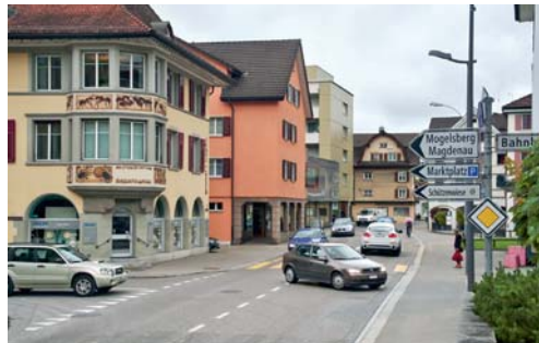
Während eines Jahres: Einbahnregelung mit Fahrtrichtung Magdenau.

und Gemeinde danken der Bevölkerung für das Verständnis.