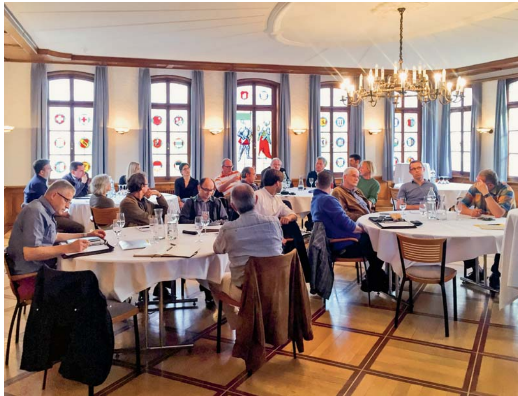
Die «Marktplatz»-Begleitgruppe hat sich zu ihrer ersten Sitzung getroffen.

formiert. Die Erarbeitung eines Gestaltungskonzeptes über einen Studienauftrag ist der nächste, wesentliche Schritt beim Projekt. Dabei werden maximal fünf Teams (Landschaftsarchitekten/Architekten) über ein selektives Verfahren zur Bearbeitung eingeladen. An ihrer Auftaktsitzung diskutierten die Mitglieder der Begleitgruppe zudem über Nutzungsideen und Bedürfnisse für den Marktplatz.