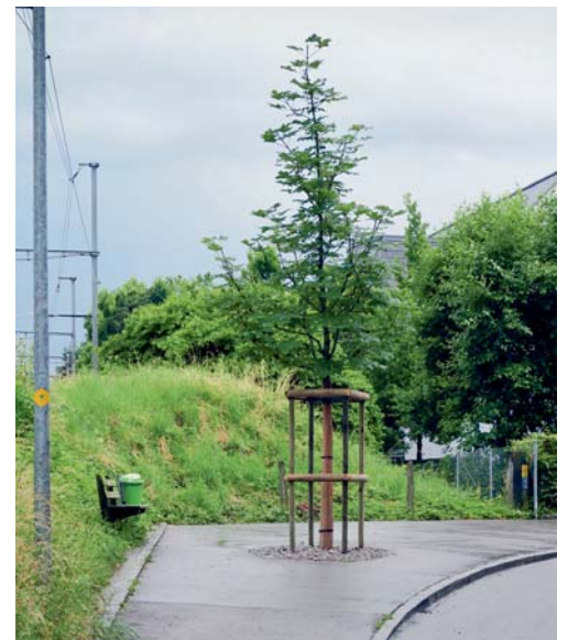
Ersatzpflanzung: der neue Kastanienbaum.

FLAWIL In der Nacht vom 16. auf den 17. Juni 2016 ist beim Kastanienbaum an der Dammstrasse, wegen den Auswirkungen eines schweren Gewitters, ein grosser Ast abgebrochen. Im Zuge der Aufräumarbeiten wurde festgestellt, dass sich der zwischen 80 und 100 Jahre alte Kastanienbaum in einem äusserst schlechten, kranken Zustand befindet. Nach Rücksprache mit dem Revierförster wurde deshalb entschieden, den Baum zu fällen. Mittlerweile wurde die Wurzel aus dem Boden rausgefräst und eine Ersatzpflanzung vorgenommen. Seit Beginn der Schulsommerferien wächst nun ein junger Kastanienbaum an der Dammstrasse.