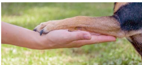
Hand in Hand oder viel eher Pfote in Hand – so geht es.