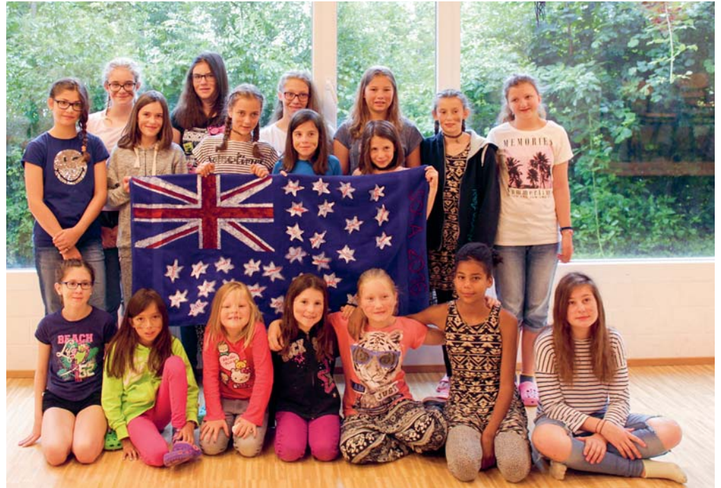
Let's have fun in Australia! – das Lagermotto. Dargestellt durch eine leicht abgewandelte Flagge und frohe Mädchen!

niere, lustige Spiele und kreative Indooraktivitäten. Anfang Woche führte eine Tageswanderung über Brunos Alp und die Ausflüglerinnen staunten über die atemberaubende Aussicht, die sich von dort oben bot. Für diese unvergessliche Woche danken die Mädchen allen, die ihren Beitrag dazu geleistet haben, und sie freuen sich bereits auf das Sommerlager 2017. Lea Iff