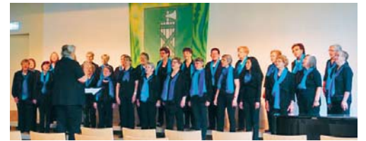
Die Frauen beim Gesangsvortrag am Kantonalgesangsfest.