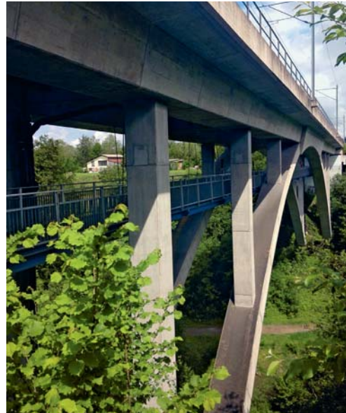
Der Korrosionsschutz des Stegs unter dem Glattviadukt wird bis Ende Juli erneuert.

kosten der Sanierung betragen 383 000 Franken. Weil es sich beim «Fürstenlandradweg» um einen kantonalen Radweg handelt, übernimmt das Strassenkreisinspektorat des Kantons St.Gallen 50 Prozent der Kosten. Die restlichen Kosten werden zwischen den Gemeinden Gossau und Flawil gleichmässig aufgeteilt.