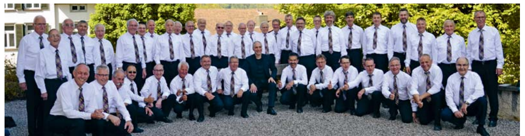
Ein stolzer Männerchor Eintracht beim Fototermin.

Am Wochenende vom 1. bis 3. Juli bewirbt der Männerchor Eintracht die Gäste in einem Festzelt am Nordostschweizerischen Jodlerfest in Gossau.