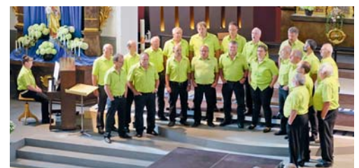
Der Männerchor Alterschwil bei seinem Vortrag.