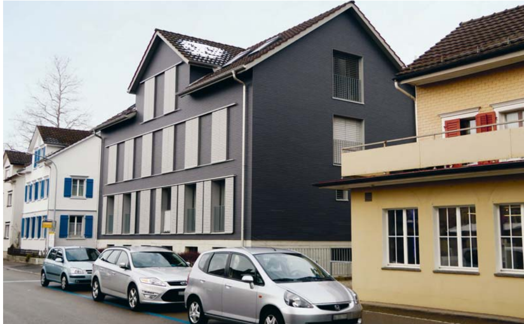
Das Stickerquartier soll erhalten bleiben, aber auch aufgewertet werden.

wie das Stickerquartier erhalten bleiben, es aber auch möglich ist, sie sensibel weiterzuentwickeln. Deshalb hat es der Rat als sinnvoll erachtet, einen Quartierrichtplan zu erarbeiten.