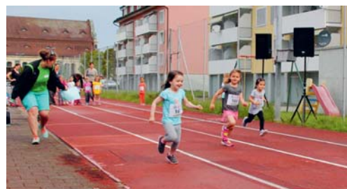
«De schnelltscht Flowiler» – Einsatz total!

VEREIN Der UBS Kids Cup konnte zahlreiche Kinder und Jugendliche begeistern. Fast 200 motivierte Leichtathletinnen und Leichtathleten massen sich in den Disziplinen Sprint, Weitsprung und Ballwurf und kürten die Sieger. Trotz Wetterkapriolen gingen alle motiviert an den Start. Mit grosser Spannung wurde am Mittag die Rangverkündigung erwartet und Podestplätze von den Sportlerinnen und Sportlern und deren Anhang gefeiert. Wer sich von den erfolgreichen, jungen Sportlerinnen und Sportlern in Flawil für den Kantonalfinal qualifiziert hat,