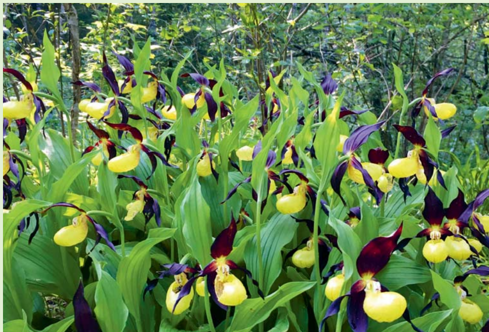
LESERBILD «Fraeschüehli» sind wieder unterwegs.