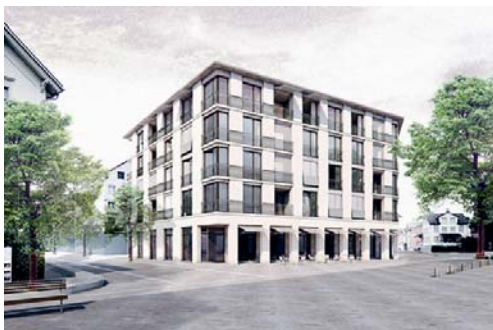
Visualisierung der geplanten Überbauung.

Im Jahr 2010 haben die Grundeigentümer der betreffenden Parzelle einen Studienauftrag unter fünf Architekturbüros lanciert. Das siegreiche Projekt eines Zürcher Architekturbüros sieht einen fünfgeschossigen Baukörper mit Flachdach vor. Die «Stiftung für Wohnungen mit Pflegeangebot in Flawil» will darin auf vier Etagen etwa