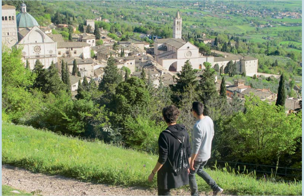
Firmkandidaten auf dem Weg mit Blick auf Assisi.