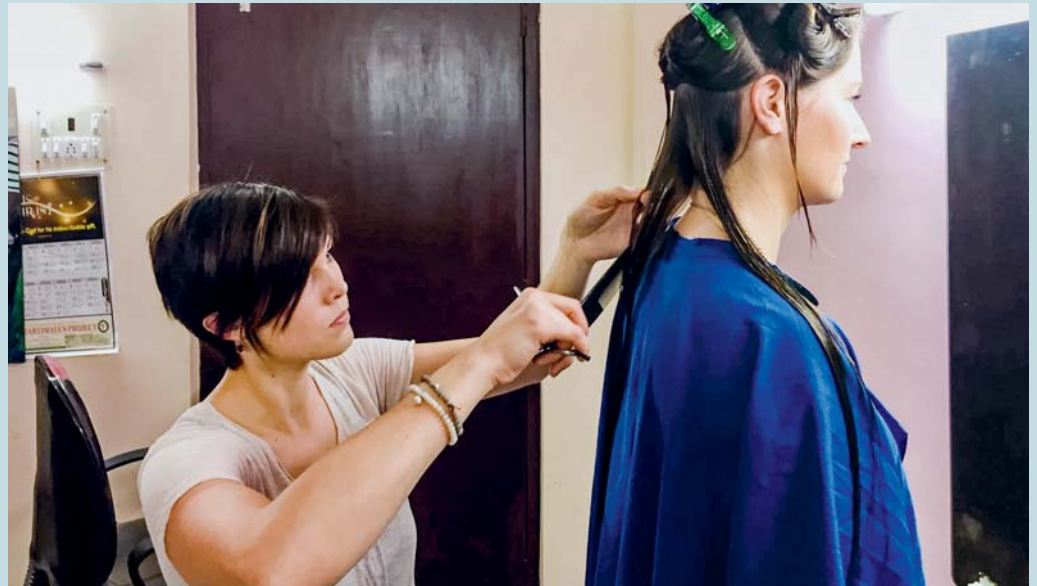
Wie soll die Welt aussehen?

Ganz nahe bei der Wirklichkeit, versöhnt leben mit sich selbst, seinen Mitmenschen und mit