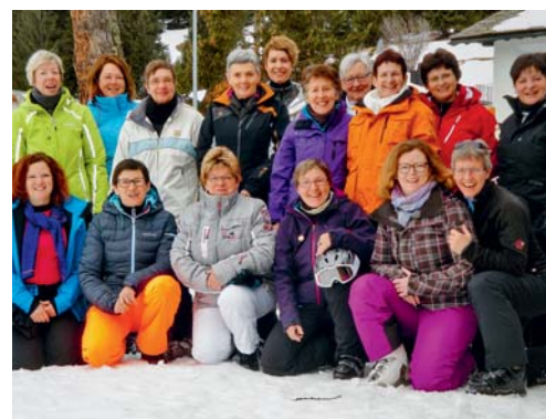
Vor der Heimfahrt noch schnell ein Gruppenfoto als Erinnerung an das tolle Skiweekend