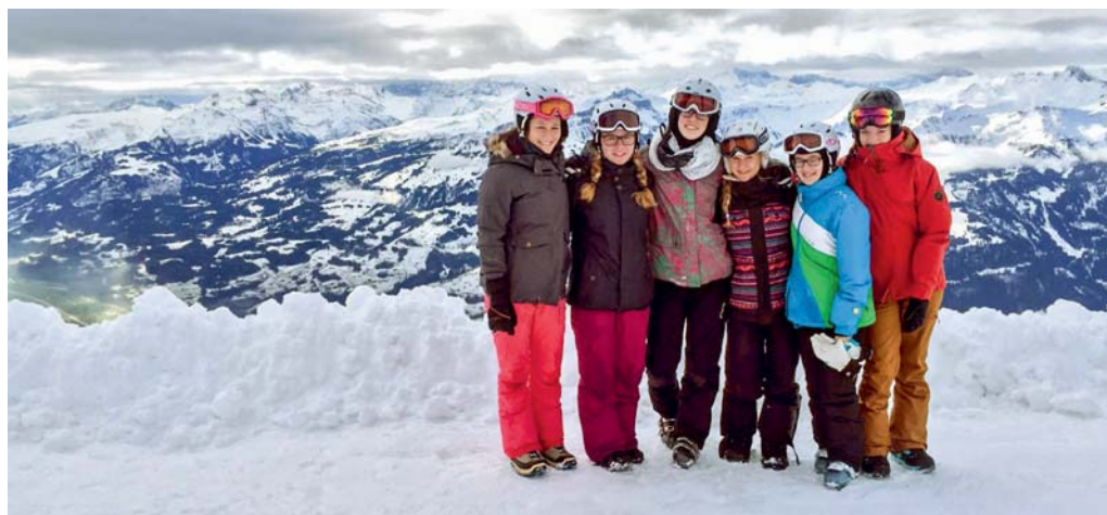
Erinnerungen an das Skiweekend in Wildhaus