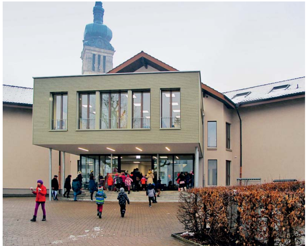
Dank des neuen Anbaus konnte das Teamzimmer im Obergeschoss vergrössert werden.

FLAWIL Die Primarschulklassen und ihre Lehrpersonen sind ins neu renovierte Schulhaus Feld zurückgekehrt. Die Zeit im Schulcontainer gehört der Vergangenheit an.