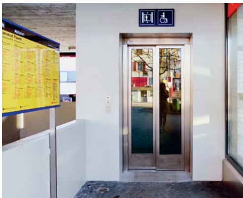
Der Lift bei der zentralen Perronunterführung wurde saniert.

Der Gemeinderat hat nun erfreut zur Erkenntnis genommen, dass sich die SBB dem Anliegen angenommen hat. Der Lift wurde saniert. Die Glastüren schaffen im Lift nicht nur ein angenehmes Klima, sondern reduzieren die Gefahr von Vandalismus. Vor allem aber dienen sie dem Sicherheitsempfinden der Nutzerinnen und Nutzer.