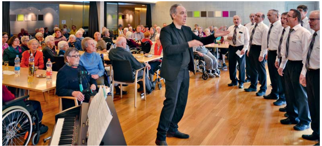
Die «Einträchtler» brachten mit ihrem Gesang viel Freude in den Alltag der WPH-Bewohnenden.