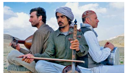
Mit dem «Trio Faran» auf einer musikalischen Reise durch die Landschaft Palästinas