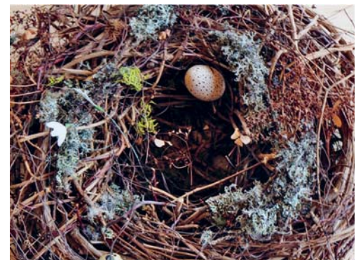
Sind sie nicht hübsch, diese Naturnester?