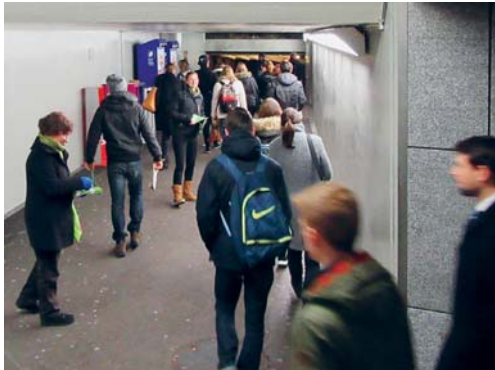
Festgestellt: In den nicht richtungsgetrenten Perronunterführungen von Flawil und Uzwil herrschen am Morgen weit engere Verhältnisse als im Gotthard-Strassentunnel.