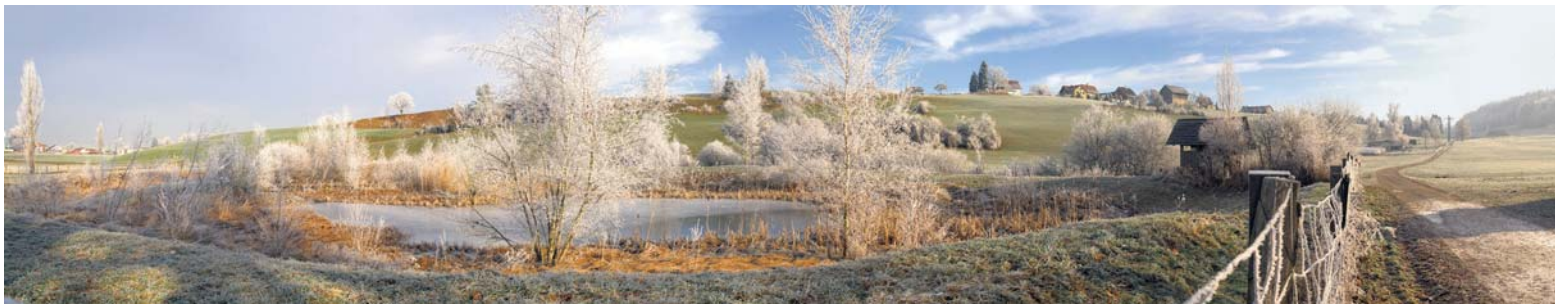
Botsberger Riet: Aufwertung und Gestaltung des Übergangsraums von Siedlung zu offener Landschaft.