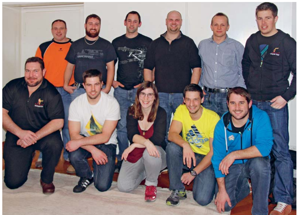
Das OK Toggenburger Verbandsswingfest präsentiert sich.

Am 14. Januar 1967 wurde der Schwingclub Flawil im Restaurant Ochsen in Flawil gegründet. Noch heute sind diverse Gründungsmitglieder im Schwingclub beim Vereinsleben dabei und erzählen den jüngeren Mitgliedern immer wieder Geschichten aus früheren Zeiten. So wurde früher im Schwingkeller im Schulhaus Grund trainiert, wobei das Wasser zum Duschen immer mit einem Gasboiler erwärmt werden musste. Heute trainieren die Schwinger des Schwingclubs Flawil jeweils am Donnerstag im modernen Schwingkeller in der Botsberghalle.