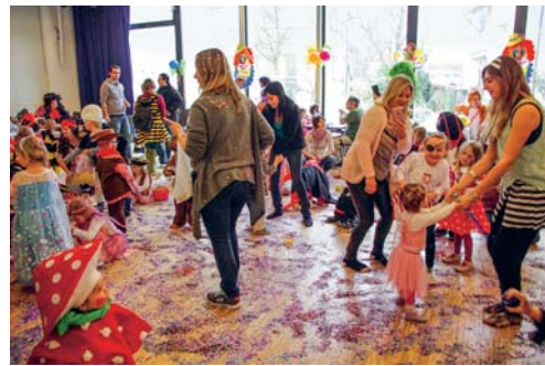
Frohes Stelldichein der bunten Gestalten im Konfettiregen.

VEREIN Am schmutzigen Donnerstag stand wieder die Kinderfasnacht im Saal der katholischen Kirche auf dem Programm. Zahlreiche Gestalten aus dem Tierreich und der Fantasie wuselten durch den Raum. Die bunte Kinder­schar genoss sichtlich den Nachmittag im Konfettiregen. Zwischendurch eine Nascherei und schon war eine kleine Tanzeinlage zu bekannten Kinderliedern angesagt. Nach dem sehlich erwarteten Auftritt der Guggenmusik war es dann aber leider schon wieder Zeit, um langsam nach Hause zu gehen. So ging ein herrlicher Nachmittag zu Ende und was bleibt, ist die Vorfreude auf das nächste Mal! Das Team des Familientreffs Flawil dankt allen Teilnehmenden für den gelungenen Anlass. Regula Wirz