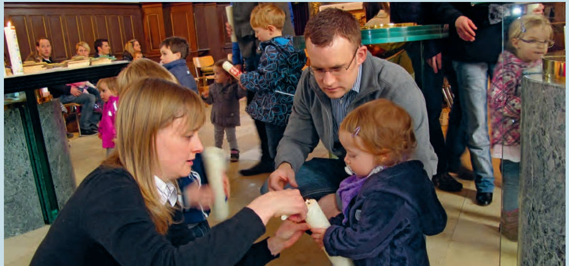
Eltern entzünden mit ihren Kindern die Taufkerzen an der Osterkerze.

Jeweils im Januar des darauffolgenden Jahres laden wir alle Tauffamilien wieder ein zu einer kleinen, kindgerechten Feier. Wir entzünden die Taufkerzen wieder, beten und singen gemeinsam und die Familien