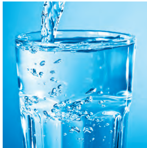
Das Trinkwasser in Degersheim entspricht den in der Schweiz geltenden gesetzlichen Anforderungen.

Das Resultat ergab, dass sämtliche Spielplätze kleinere Sicherheitsmankos aufweisen. Es liegen jedoch keine gravierenden Mängel vor, die eine Schliessung der Spielplätze rechtfertigen würden. Der Gemeinderat hat beschlossen, die Mängel zu beheben und im Budget 2016 dazu einen entsprechenden Betrag vorzusehen.